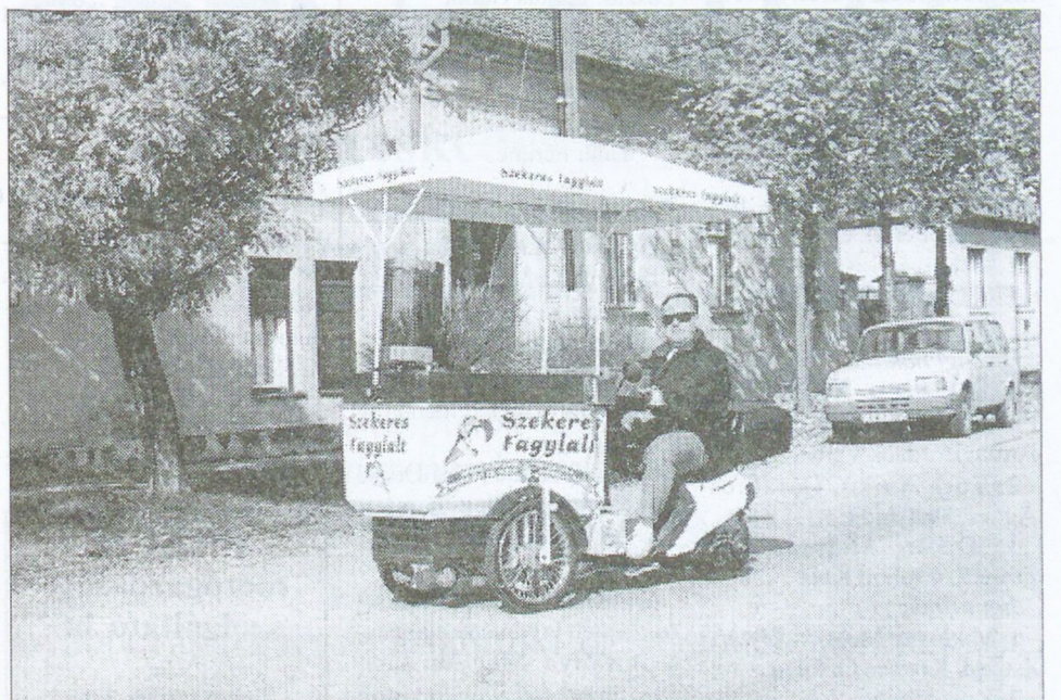
Senki se lepődjön meg, ha jövő tavasszal, illetve nyáron a régmúlt időköt idező fagyaltoskoesi csilingelését hallja majd a mohácsi utcákon.