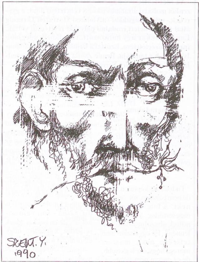
Szentandrassy István grafikája

együtt dolgoztak. Gyerünk Póka Madamehoz!