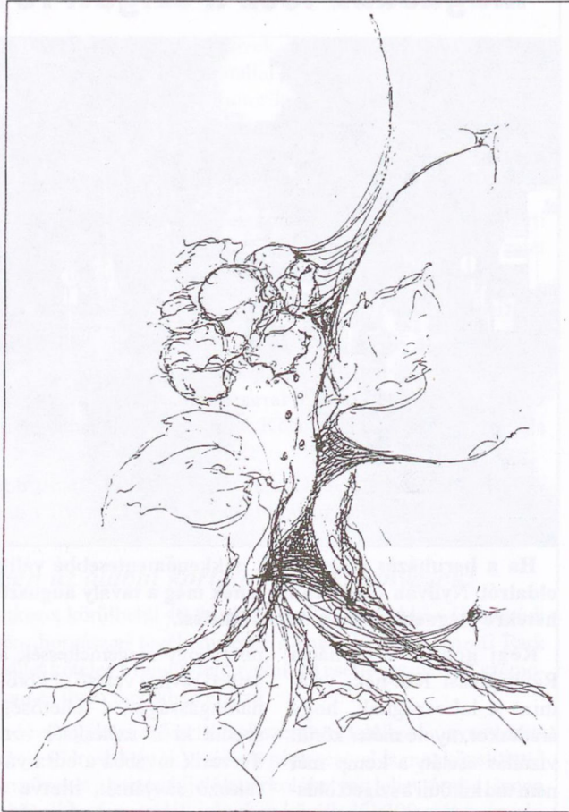
Kalányos Mónika rajza