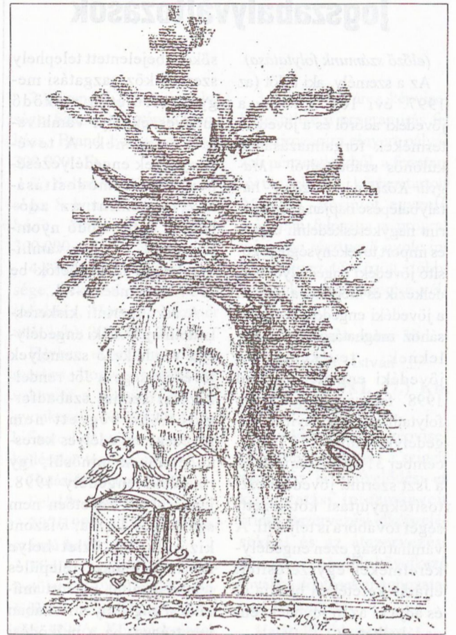
Morvai Péter rajza

Máriák kegyelme újregi latrok csillagszikla harangok