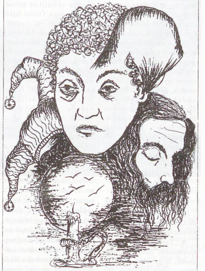
Szigeti Szabó János grafikája