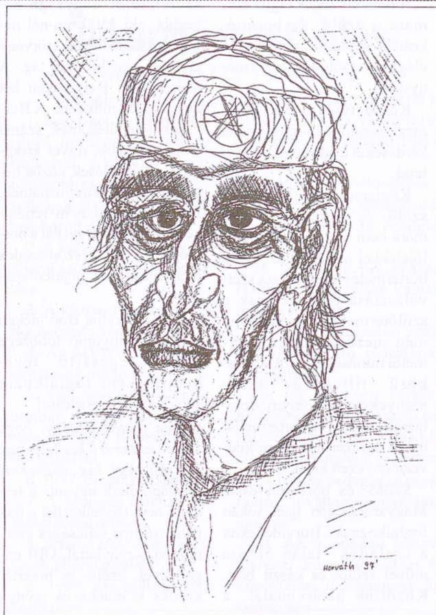
Horváth Zoltán grafikája