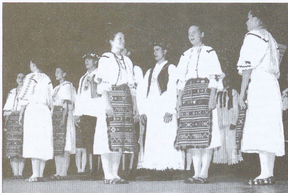
November 22-én - szombaton - este rendezik meg a „Mohács” Nemzetiségi Néptáncegyüttes (felvételünkön) önálló horvát-estjét. A program 19 órakor kezdődik a Kossuth Filmszínházban. Mindenkit szeretettel várunk!