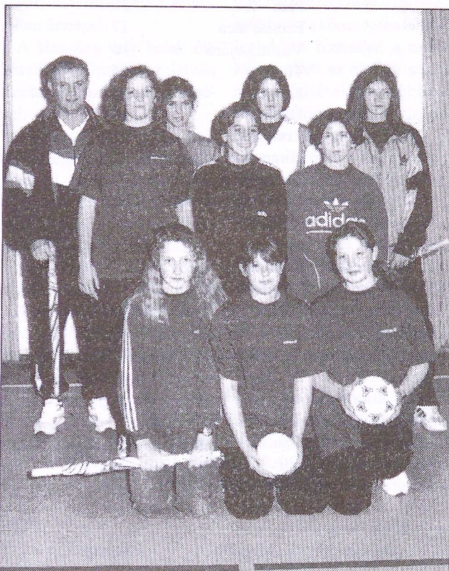
Képünkön a diadalmaskodó bólyi csapat, amelyet ezúttal nem sikerült az ellenfeleknek megszorogatniuk.

Az elmúlt hétvégén, január 18-án második alkalommal rendezte meg a Pikker Kft. és az MTE női kézilabda-szakosztálya a körzet általános iskolái részére ezt a tornát, amelynek célja a sportág népszerűsítése mellett a körzetben feltűnő tehetséges lányok felmérése és esetleg az NB II-es szakosztályhoz irányítása.