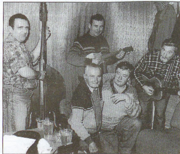
A nap sikere ezúttal sem a Ciró-Márón múlt...