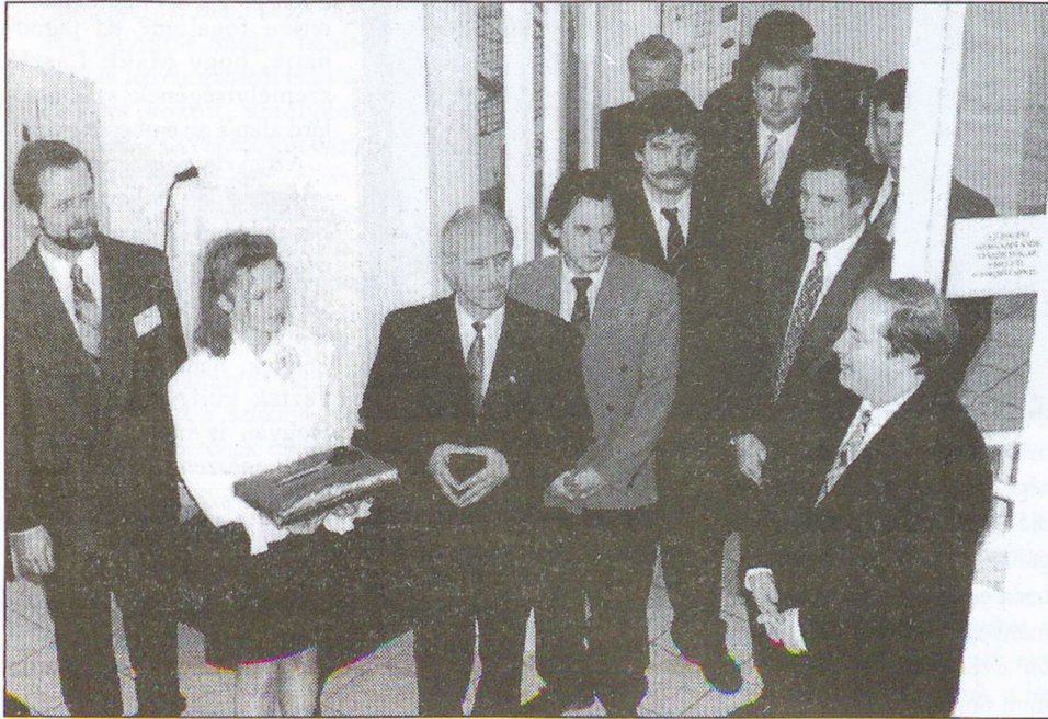
Az átadás ünnepélyes pillanata: Kiss Péter munkaügyi miniszter felavatja a város új munkaügyi központját

A regisztrált munka nélküliek száma csökkenő tendenciát mutat - állapította meg Kiss Péter. Az egyes régiók között azonban nagy a különbség. A tartósan állás nélküliek mellett nagy gondot okoz az elhelyezkedni nem tudó pályakezdők viszonylag