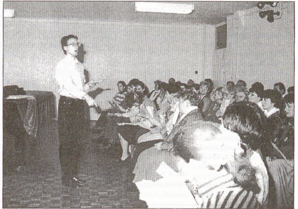
„Tele voltam várakozással, de rövid idő alatt kiderült, hogy nagyon jó csapattal találkozhattam...” - mondta az első próbáról az újdonsült kórusvezető.

Bizonyára többen emlékeznek még arra, hogy 19 évvel ezelőtt alakult meg a Bartók Béla Művelődési Központ Vegyeskara Mohácson Krausz György Liszt díjas karnagy vezetésével. 1996-ban nyugállományba vonulását követően Krausz György a karmesteri pálcát is letette. Úgy éreztük tele van még tervekkel, de jött a hirtelen döntése, 19 évi eredményes, küzdelmes munka után.