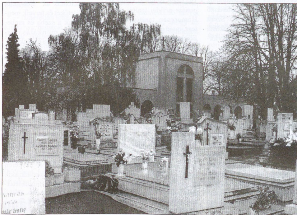
November első napjában a kegyelet és az emlékezés ünneplőbe öltözteti a temetőt.

A Reformáció nagy vívmányai közé tartozik a széleskörű iskolaszervezet és kul-