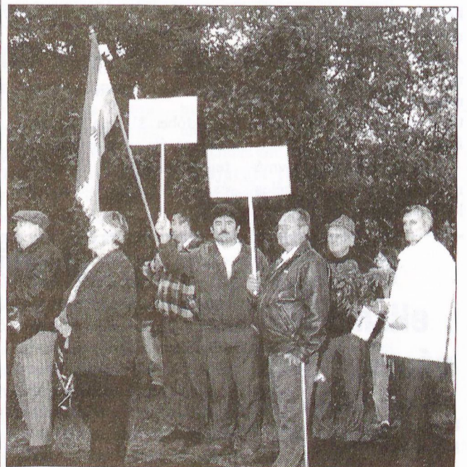
Az ünnepség résztvevőinek egy csoportja