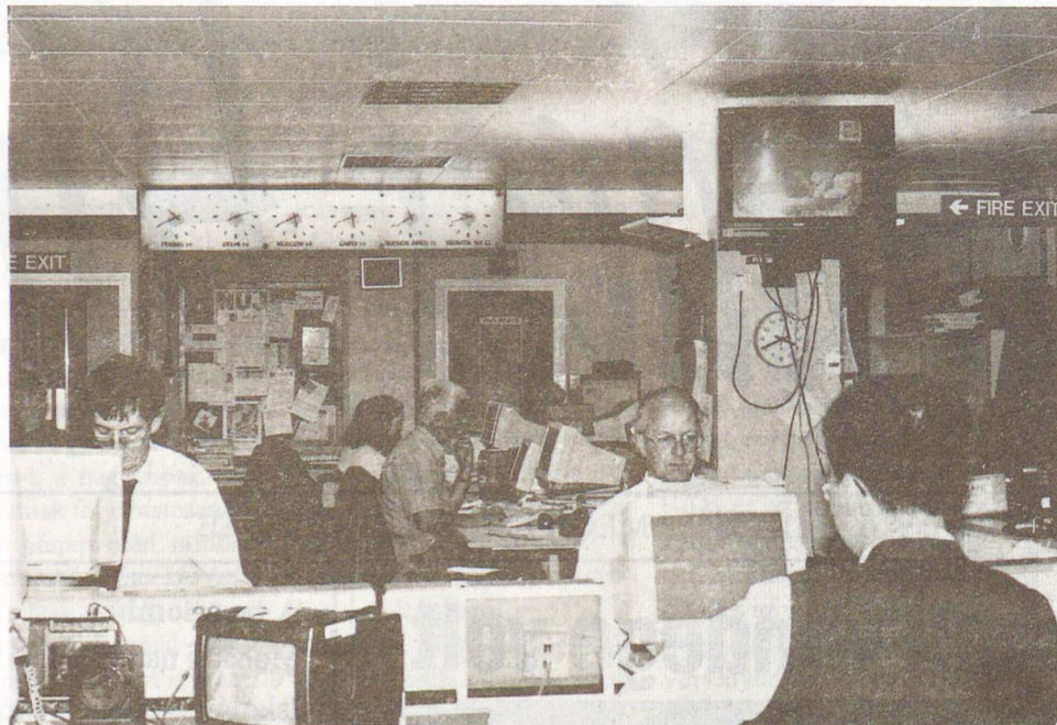
BBC hírfogadó osztályának részlete. Felül — középen — a világ óra állással azonos időben

Külön megtiszteltetés számunkra, hogy a magyar osz-