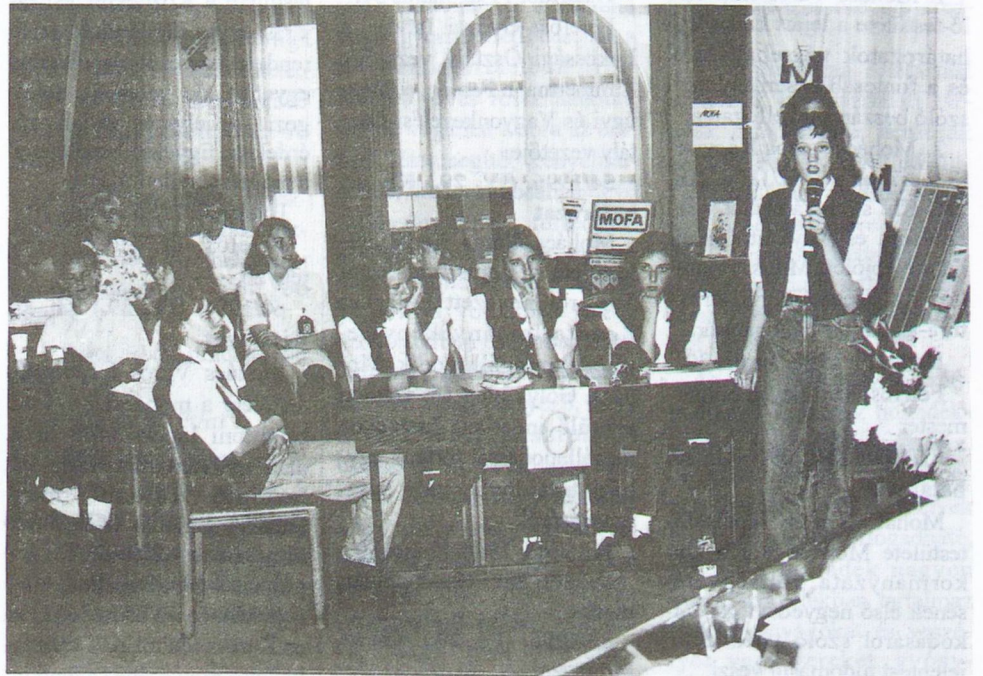
Verseny közben a győztes mohácsi csapat tagjai

Széchenyisek jóvoltából országos verseny döntője Mohácson