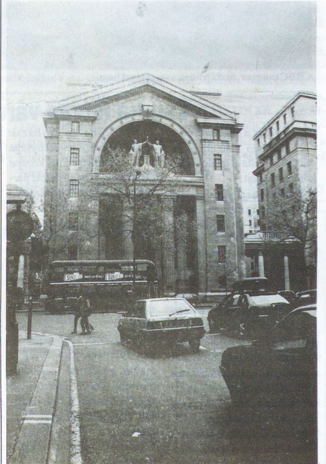
A BBC épületének főbejárata

busza várta, ami a Hayd-park-hoz közeli szálláshelyünkre vitt bennünket. Majd kezünkben a híres londoni metrójeggyel, és indulás a Bush House-ba, a BBC világszolgálatának székházába. A belépésre