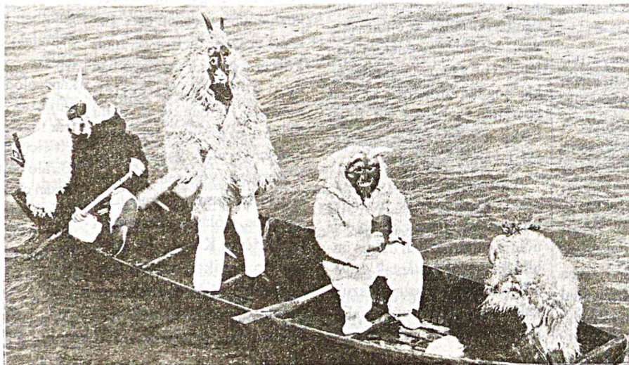
A busók egyes csoporttal csónakkal érkeznek