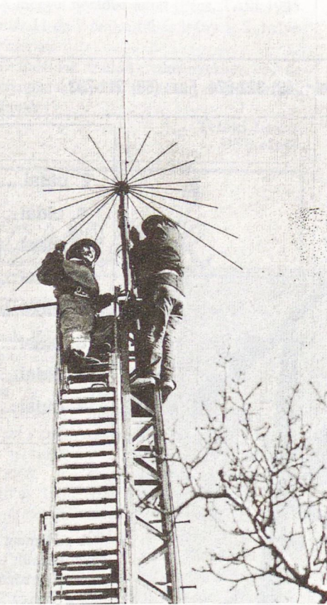
25 méteres magasságban sugároz az URH antenna a 103,7 MHz-n

Amikor beadtuk pályázatunkat a Mohácsi Hírlapra, merész gondolatnak találtam. A rádiónál már én bátorítottam férjem. Az írott sajtónak is ör-