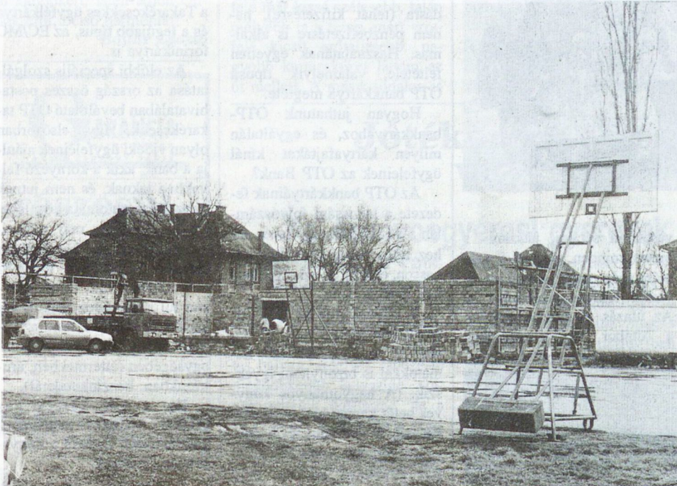
Jó útemben halad a Marek tornatermék építkezése

életmentés: 5 épületbaleset: 1 segítségnyújtás: 6 megyei területre: 2 más megye területére: 4 Tüzesetek részletezve: vonulások tüzeset: 77 utólagos tüzeset: 15 részletes vizsgálat: 32 nem részletes vizsgálat: 60 Nemzetgazdasági jelleg szerinti megosztás: ipar: 5 lakás, személyi ingatlan: 31 mező- és erdőgazdálkodás: 29 közlekedés: 5 egyéb: 22