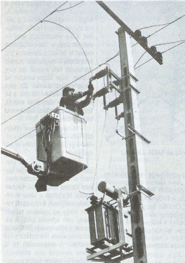
Helyére került az utolsó biztosító patron a középhullámú adó áram ellátását szolgáló transzformátoron.

Napló, a Körzeti Televízió és Rádió, az MTI tudósítója, a Pécsi Horvát Nemzetiségi Műsor szerkesztője és sokan mások is érdeklődtek.