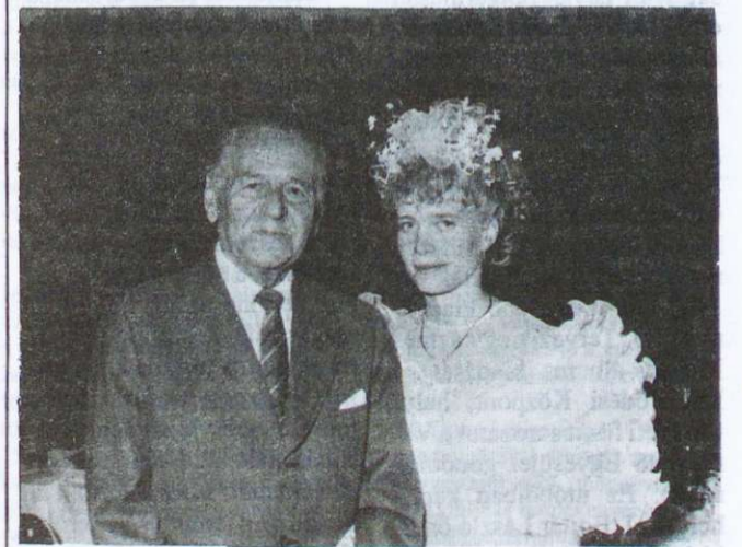
A díszpolgár unokája esküvőjén