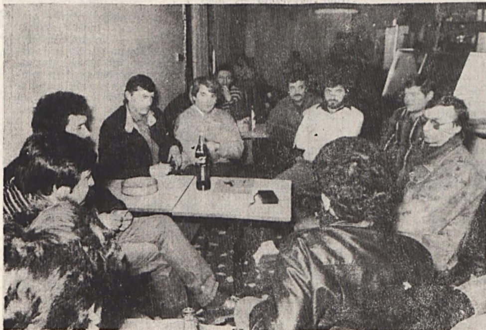
Az arcokon nem sok öröm látszik.