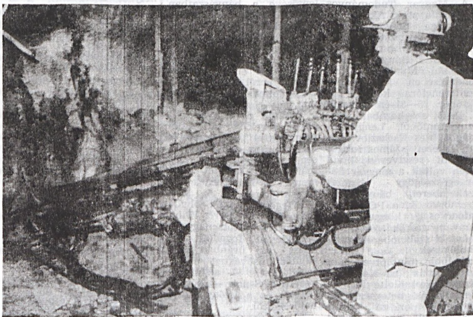
Meddig dolgozik még a fúrókecs?