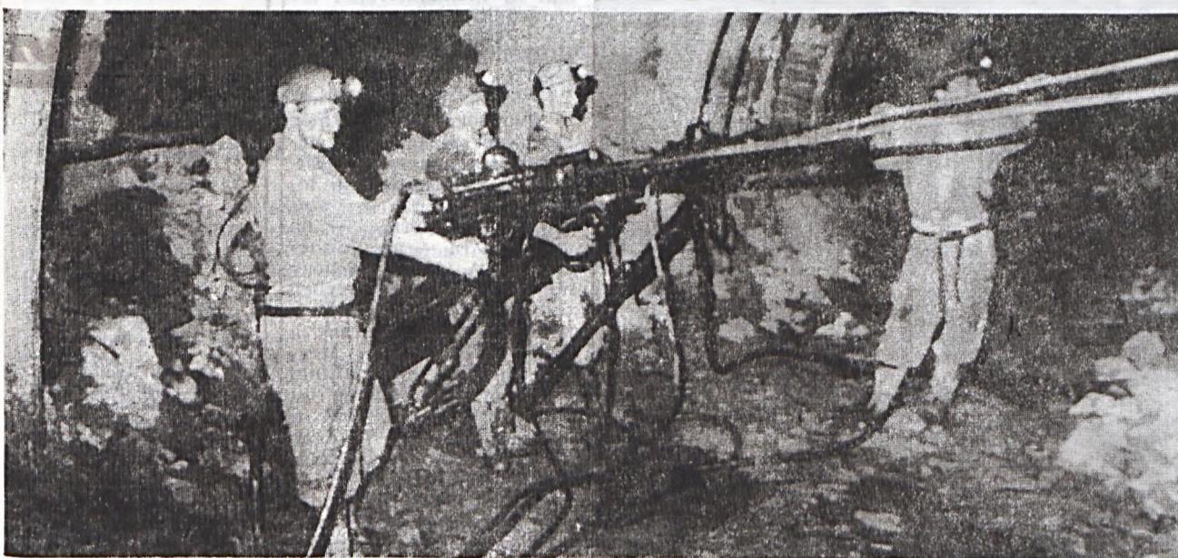
A IV. sz. bányauzem 13-as csapata. (Cikkünk a 3. oldalon.)