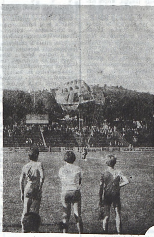
...ejtőernyős ugrás és reméljük jó idő.