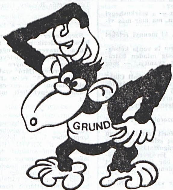
Lesz még Csimpi sorsolás...