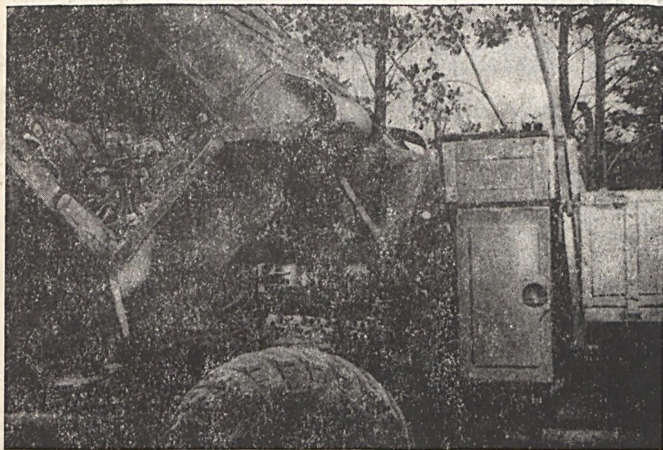
A műhelyek zsúfoltsága miatt a szabad ég alatt is dolgoznak a szerelők. Felvételiükön Öbert Csaba látható egy GAZ 66-os tehergépjármű karburátorának javítása közben.