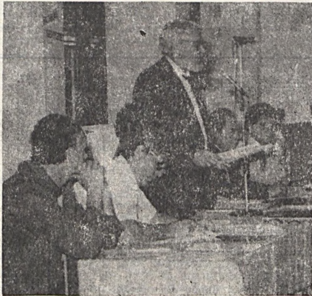
Az összbizalmi értekezlet elnöksége.