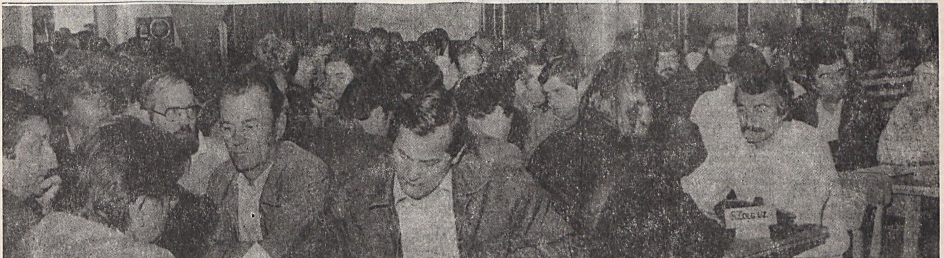
A hatóság tanácskozás küldötteinek egy csoportja.

Szólt a jogsegélyszolgálat változásáról, a lakástámogatás olyan értelmű módosulásáról, hogy a felfüggesztett kölcsön helyett javasolják a kamatmentes kölcsönt, és az egész lakástámogatási szabályzat át-