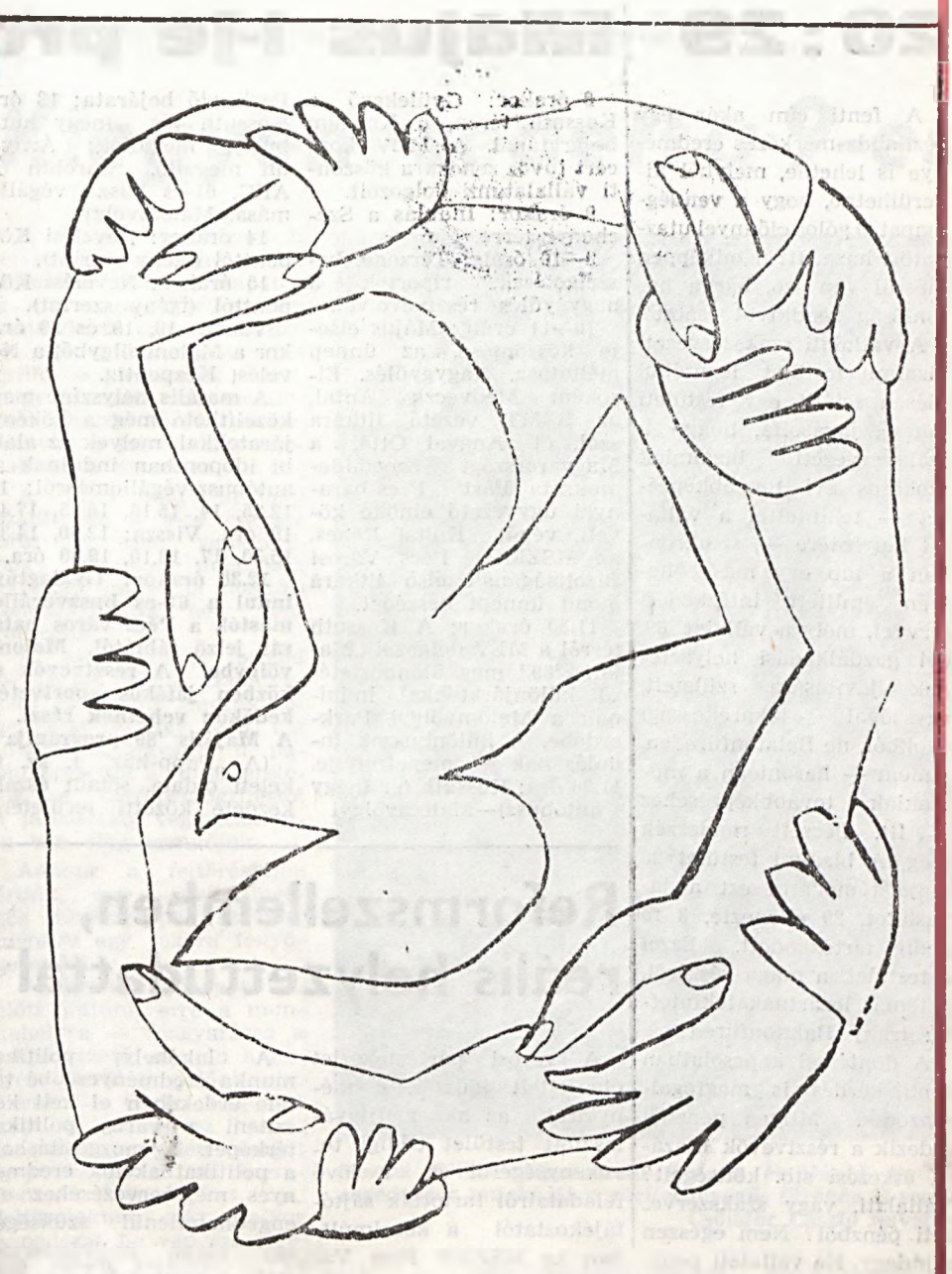
Pablo Picasso rajza