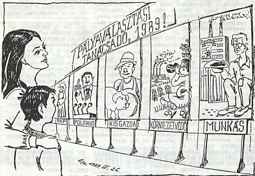
Na, mi akarsz lenni, kisfiam?