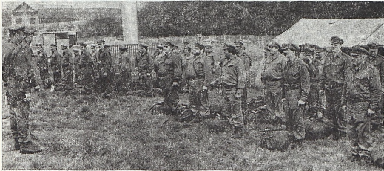
Vállalatunk munkásai — túlnyomórészt szabadidejükben — kétnapos kiképzésen vettek részt Kisvaszaron.

A kollektív szerződés elfogadott 6. sz. módosítását, kiegészítését sokszorosítás után megkapja minden szakszervezeti bizalmi és munkahelyi vezető, akiknél a részletekről érdeklődni lehet.