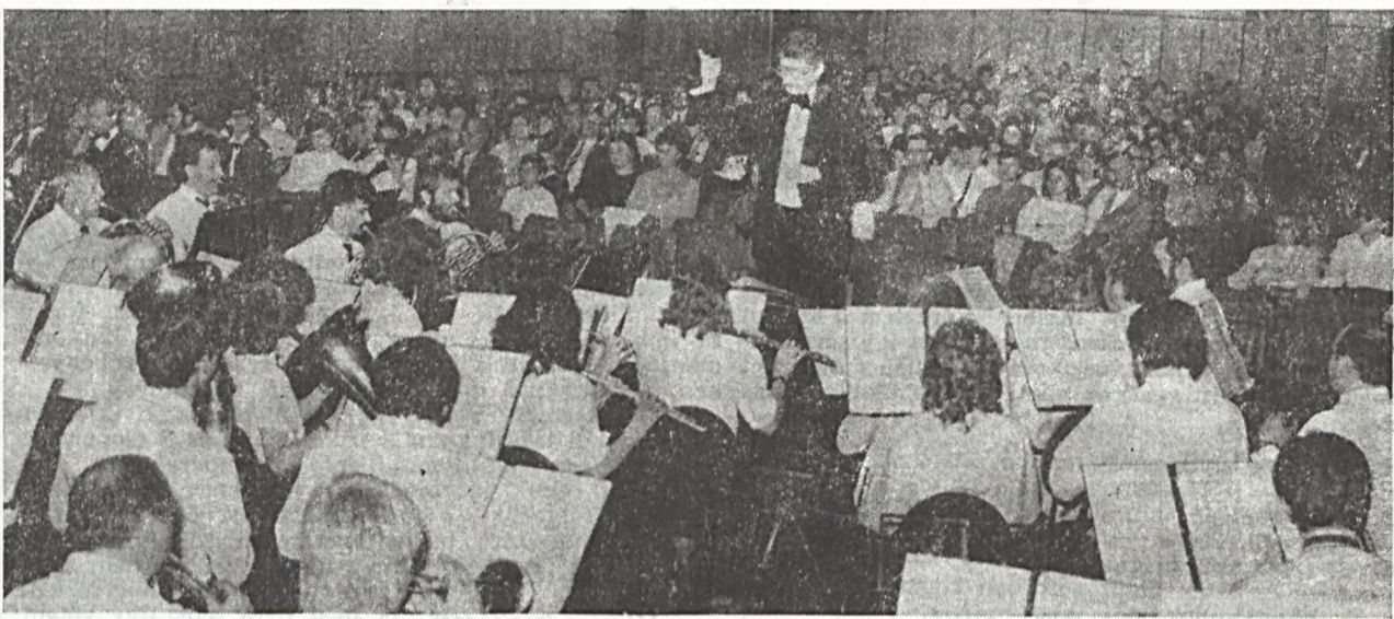
Ötszáznyolcvan vásároltak jegyet arra a jótékonyági koncertre, melyen Pécs három legnagyobb fúvósze- kara: a Pécsi Vasutas Koncert-fúvószenekar, a Mecseki Szénbányák Koncert fúvós zenekara és a Mecseki Ércbányászati Vállalat Koncert fúvós zenekara adott hangversenyt a POTE aulájában. Az est teljes bevételét gyógyászati segédeszközök vásárlására fordítják. Képviselet a MÉV Koncert fúvós zenekaráról IIáry Ba-