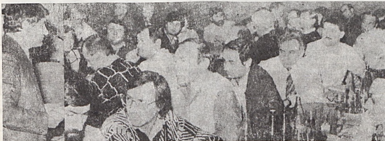
Felvételünkön a bizalmi testület tagjai a vállalat vezérigazgatójának bérpolitikai irányelvekről szóló előterjesztését hallgatják.