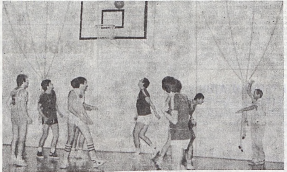
A bírő már sípolt, de a kosár még jó lehet. Így aztán a miénk (sötét mezben) még a labdát szuggérálják. Csöndör László felvétele a közelmúltban lezajlott MÉV—Meteor (56-48) mérkőzés egyik izgalmas pillanatát örökítette meg.