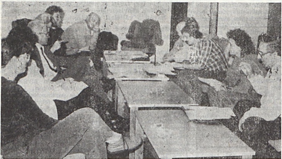
November 14-én került sor a Ságvári Endre Művelődési Ház társadalmi vezetőségének soros ülésére. Napirendjén szerepelt a Quadró táncsoport tevékenységéről szóló beszámoló, illetve tájékoztató hangzott el a művelődési ház és a MÉV üzemeinek kapcsolatát vizsgáló felmérésről.