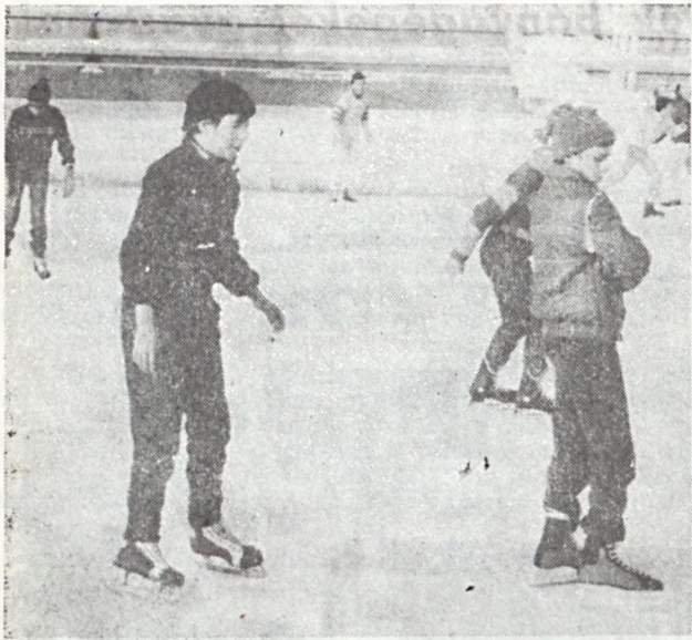
Vidám élet folyik a téli sportágak közül talán a legnagyobb sikerű műjégpályán.