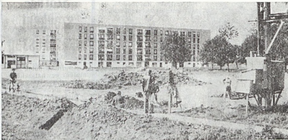
Felvételünkön a buszpályaudvar térképészén, földmunkáin dolgoznak.