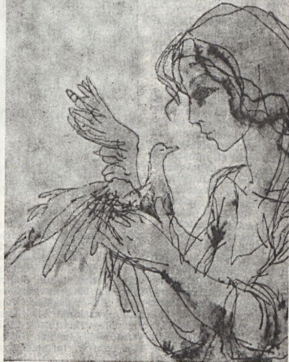
Cser György montázsja