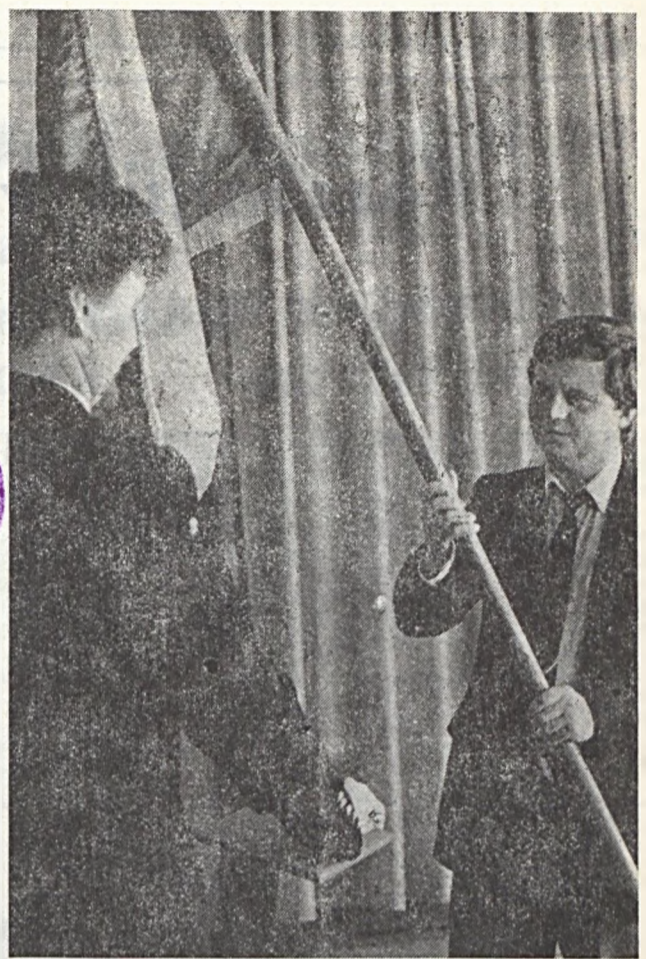
KISZ KB Vörös Vándorzászló átadása.