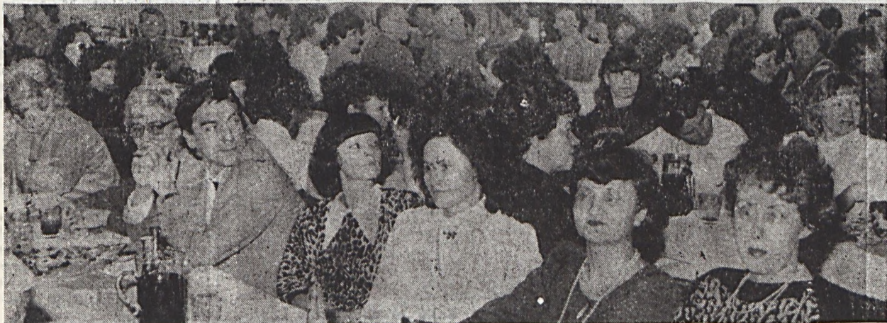
Képünkön a nőnap ünnepség résztvevőinek egy csoportja látható.