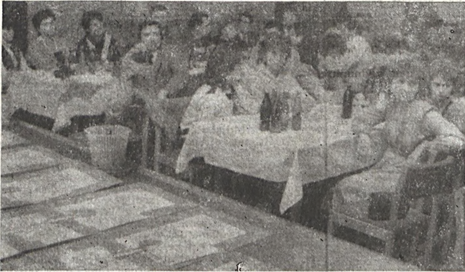
A meghívott vendégek és a sportolók figyelmesen hallgatják a beszámolót.