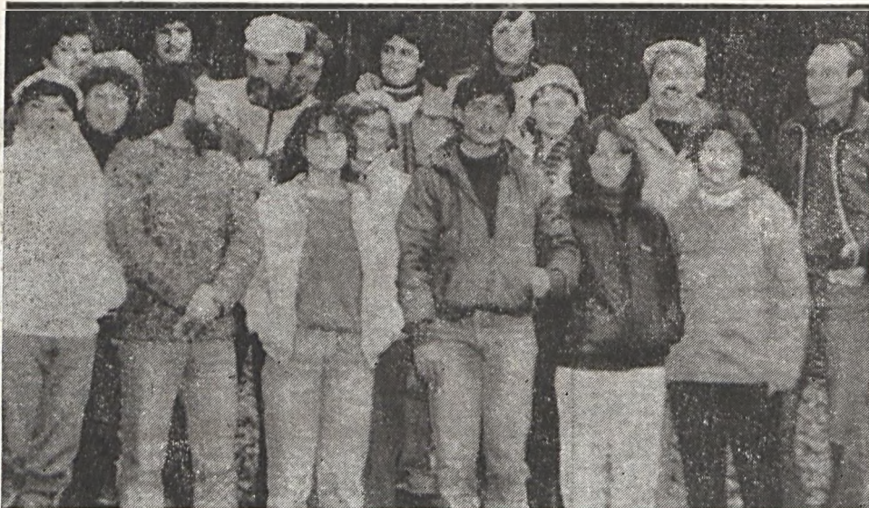
Az ismerkedési túra résztvevői.