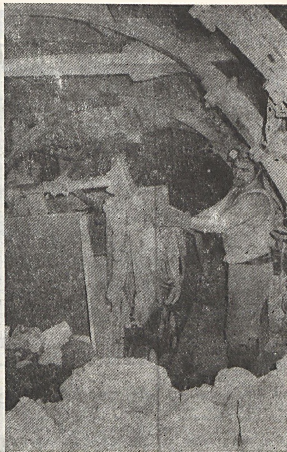
A kő; a gép és az ember...