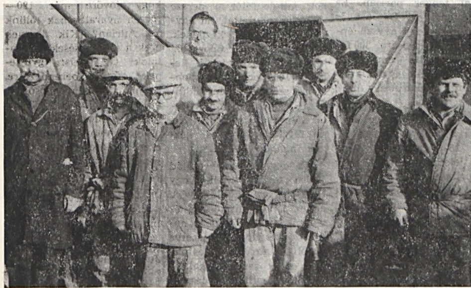
A Május 1 szocialista brigád műszakváltás közben.

— A három műszak mellett jut időnk mindenre. Szeretjük az izgalmas, szórakoztató mozifilmeket, a családosságot, a közösségi életet, a vetélkedőket.