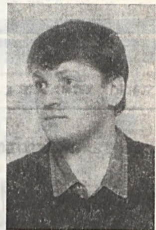
látom el a KISZ-titkári teendőket.

— A hozzászólások egy-egy részlethez kapcsolódtak. Például elfogadták a sportról szóló beszámolót, de javaslatokkal éltek a programokra vonatkozóan, illetve ellenvetéseik voltak. A hozzászólók között a társadalmi és gazdasági vezetők képviselői is szót kaptak és hozzászólásaikra jellemző volt, hogy az éves terv teljesítéséért végzett munka pozitív elemeit emelték ki.