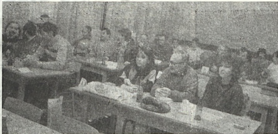
Képzünk az MM vállalati vetélkedő résztvevőinek egy csoportja látható.

A játék, melynek célja, hogy a szocialista brigádoknak folyamatos, rendszeres és változatos művelődési lehetőséget adjon, a finisbe érkezett. Amikor ezeket a sorokat írjuk, a csapatok már a városi döntőre készülnek, s mire olvassák, már eldől, hogy ott kik használták fel legeredményesebben eddig gyűjtött ismereteiket.