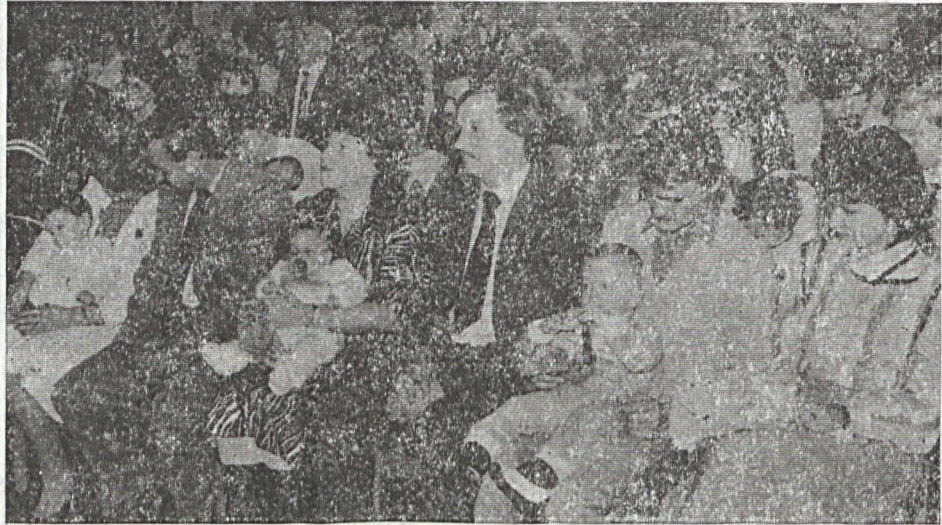
Az első fontos állomás...

A szép hagyományokat követve, immár sokadik alkalommal rendezett névadó ünnepséget a III. sz. bányüzem nőtisztviselői és KISZ-bizottsága az üzemben dolgozók gyermekei részére. A legutóbbi ünnepségre november 15-én került sor a Hunyadi úti Boldogság Házában.