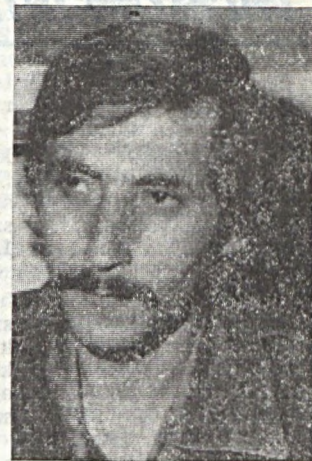
Várhelyi János Berényi Tamás felvételei