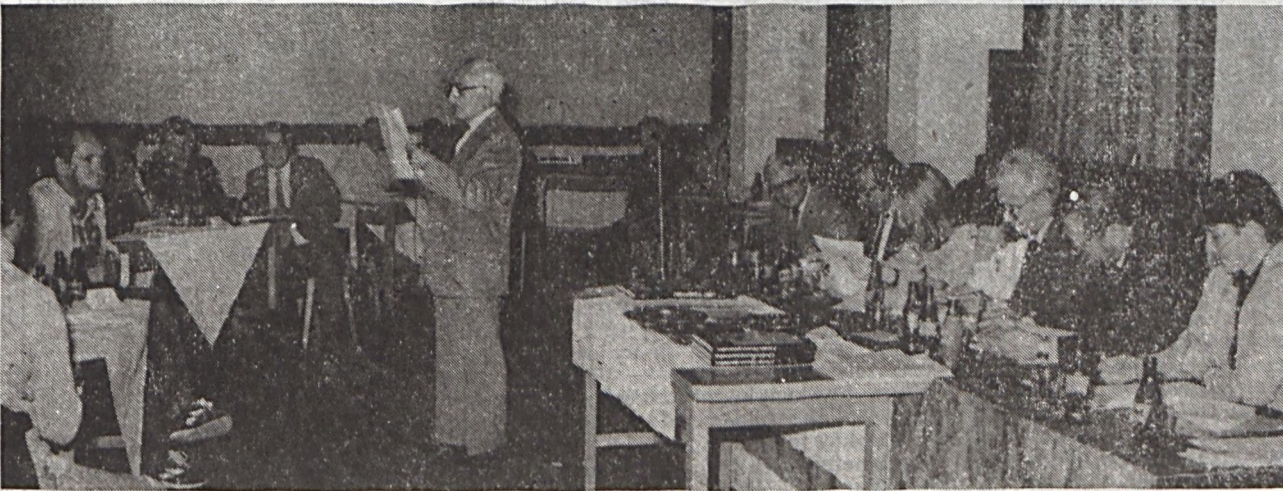
Tudósításunk a 2. oldalon.