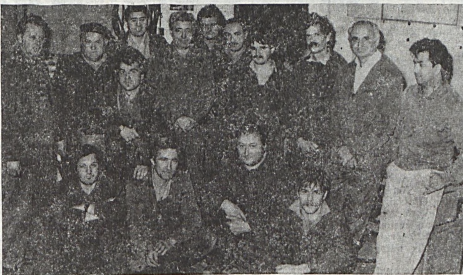
A József Attila szocialista brigád.

Így él, dolgozik a József Attila brigád az Ércdúsító üzemben, ahol éjjel-nappal csattognak, zakatolnak a törőgépek.