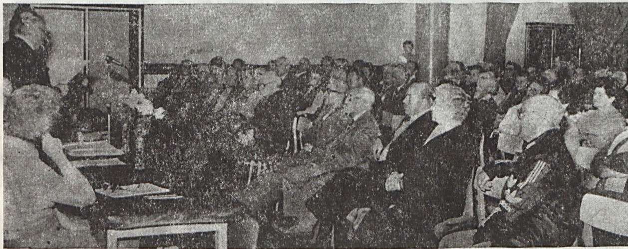
Cikkünk a 4. oldalon.