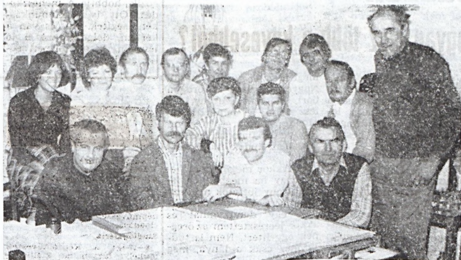
A Lambrecht szocialista brigád.

— Talán megemlíteném azt, hogy a számítógépes adatfeldolgozás beállításával együtt jelentkező problémákat úgy tűnik sikere-