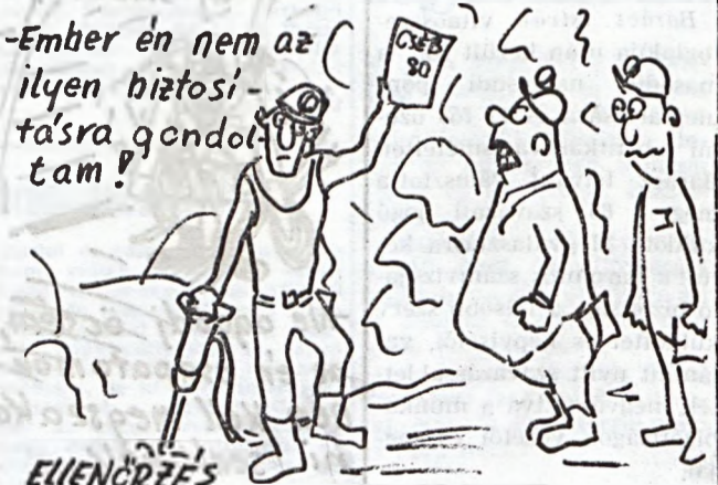
Németh István rajza

A korábbi csoportos edzéseknél a megoldandó probléma csak néhány versenyzőt kérésztett önálló gondolkodásra, mert a jelenlévők egy része nem tudta megoldani a felállított állást, más része pedig szinte azonnal megoldotta. Ezt a problémát küszöböll ki a kiadvány.