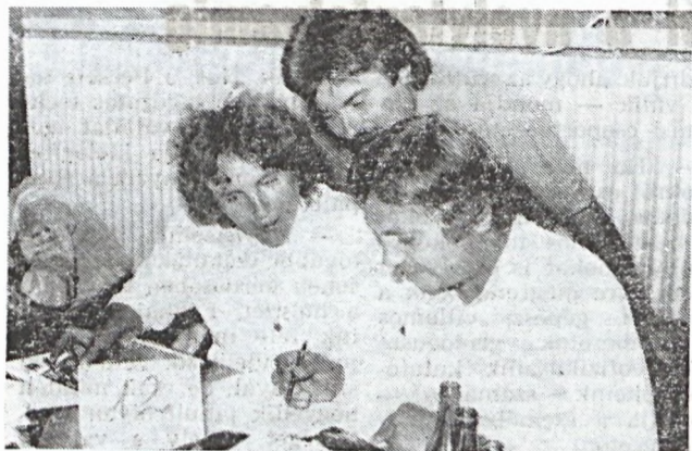
Az elődöntőben győztesek közül a két legjobb csapatról a II. Rákóczi Ferenc (Központ) szocialista brigádok.