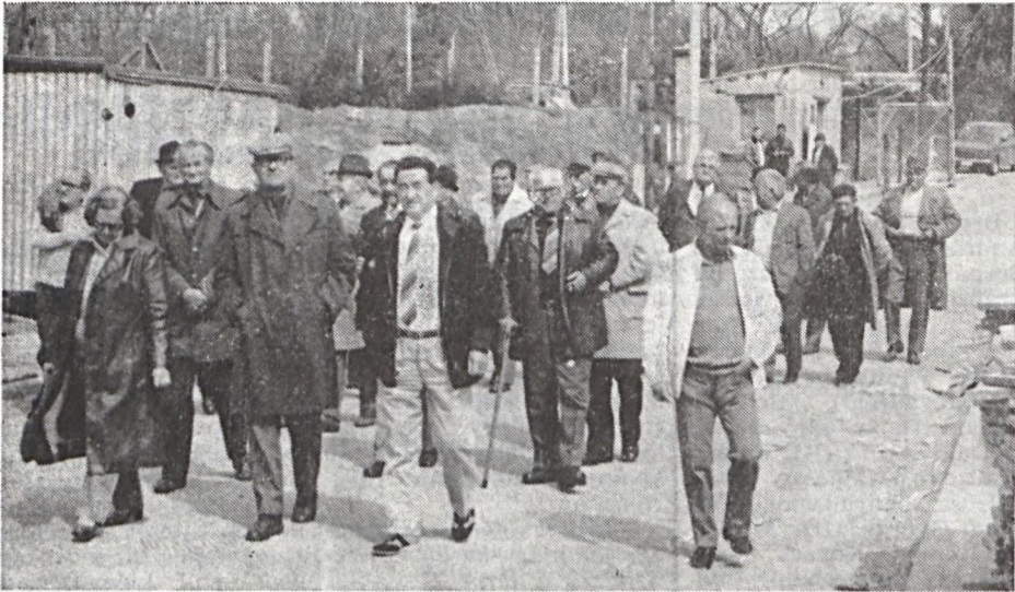
Nyugdíjasaink megtekintették az V. sz. bányauzemet is.