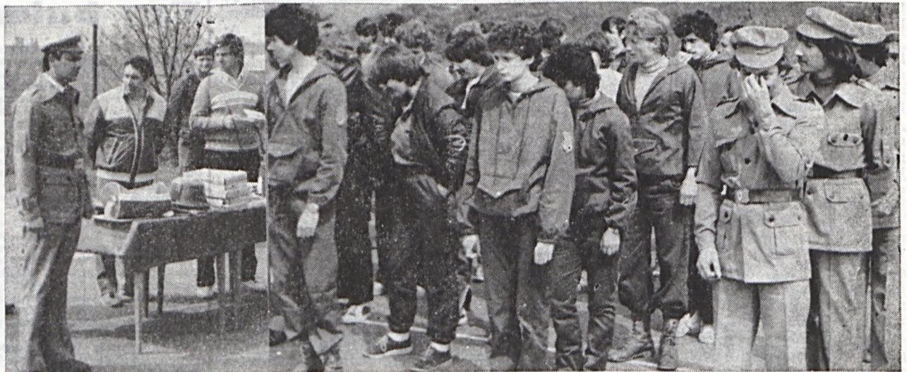
Felvételünk a lövész eredményhirdetésén, illetve a jutalmak átadásán készült.