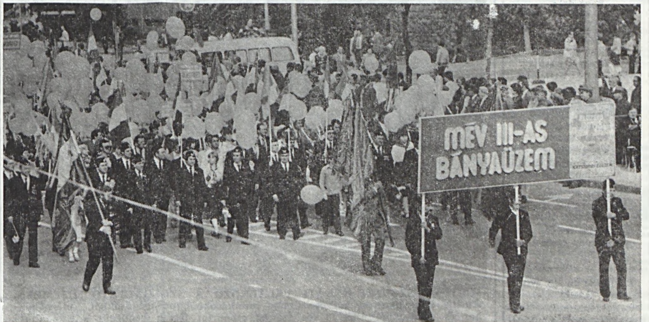
Köszöntjük az 1983-as évi kiemelkedő munkája alapján az Élüzem és a Vállalat kiváló üzeme címet elnyert III. sz. bányauzemi kollektívát!

A műsorban a Bóbita Bábszínház előadásában láthatjuk majd a Piroska és a farkas, valamint az Egér és az oroszlan című bábjátékot, majd ezután a Hetvehelyi Nemzetiségi Fúvőegyüttes gazdag programja szórakoztatja a résztvevőket.