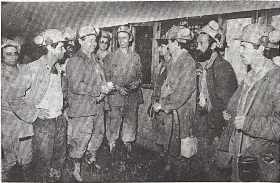
Műszakváltás az 1. sz. csapatnál.