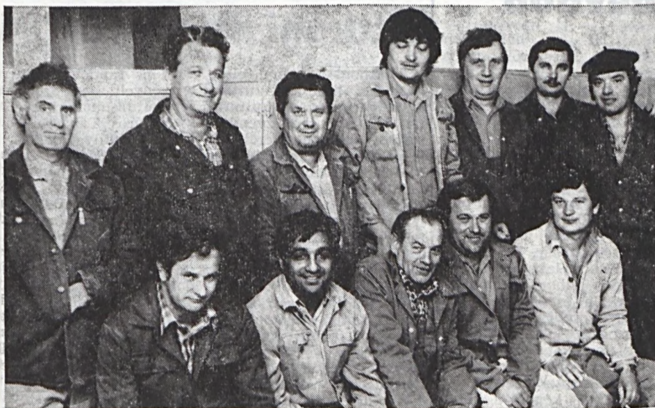
A jól végzett munka tudatában, az arcokon derű és mosoly.