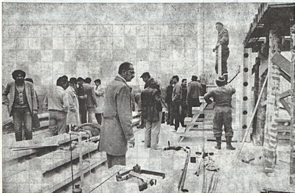
Felvételünkön a vállalat és az üzemek vezetői megtekintik az Ércbányász utcában a polistírol betonból épülő lakóházat.