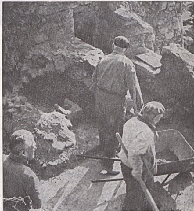
Felvételeinkön a kolostor konyhájának feltárási munkáit végzik.