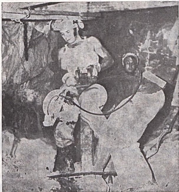
Gyakorlati verseny a II. sz. bányauzemben.