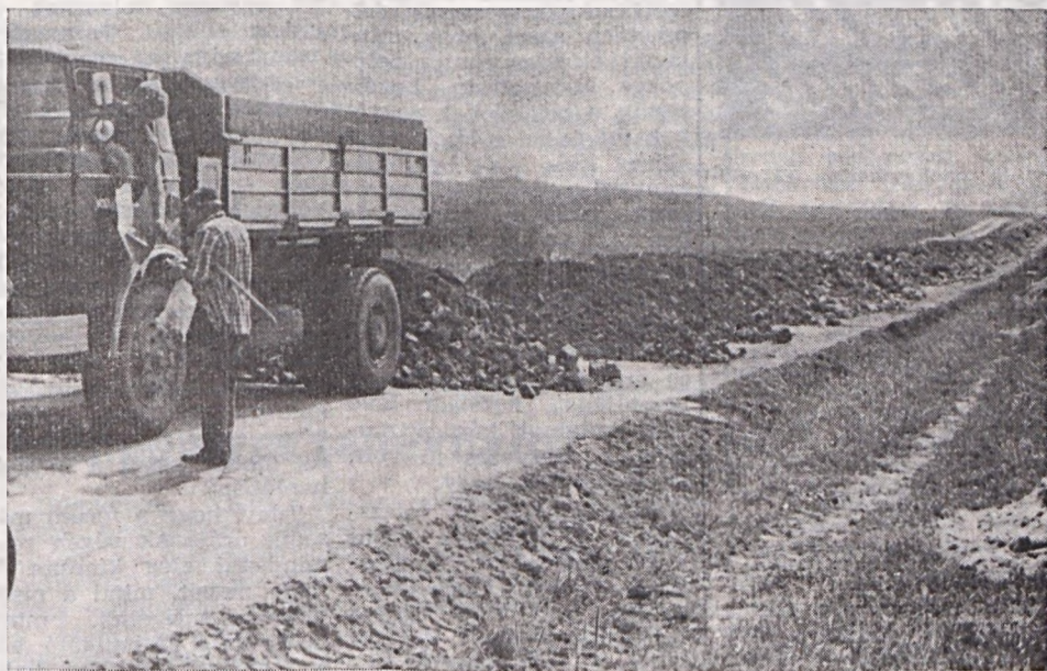
Készül az ÉDU új zaglyterét kiszolgáló kezelőút. A Volán tehergépkocsik az alap kihordását végzik.