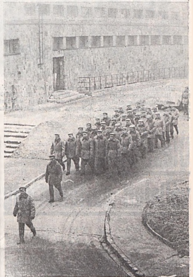
A munkásorség 3. százada elindul az újmecskaljai körlettől a POTE aulájában tartandó zászlóaljgyűlésre.