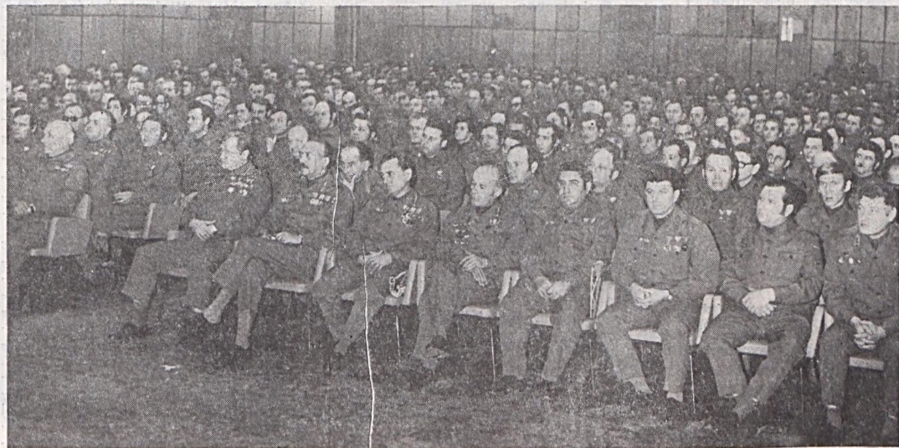
A zászlóaljgyűlés résztvevőinek egy csoportja a POTE aulájában.

Az Internacionálé hangjaival ért véget az ünnepélyes egységgyűlés.