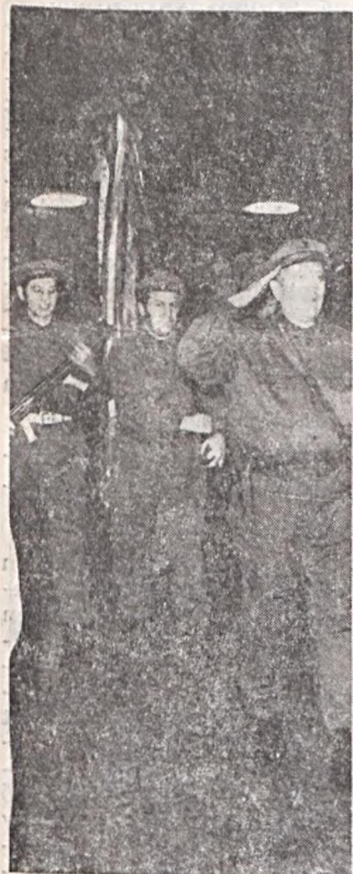
Az újonc munkásörök eskütételéhez felvezetik a zászlót.

des, helyőrségparancsnok, valamint a vállalatok, üzemek politikai, társadalmi, gazdasági vezetői és a társ fegyveres testületek képviselői.