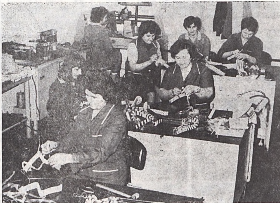
Az EDÜ Szinkron szocialista brigádja a Szolgáltató üzem részére egy 320 kW-os RDK típusú kompresszor motor állórész tekeréseit szalagozza.