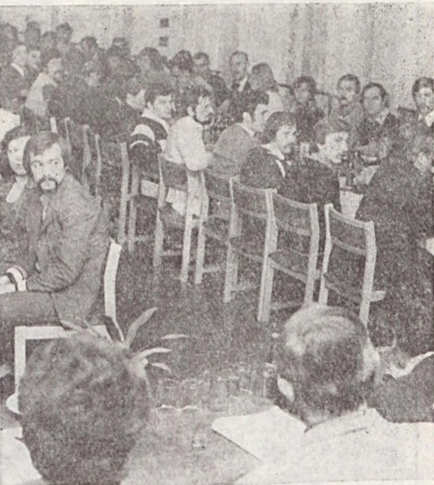
Az üzemi fiatalok küldöttel figyelemmel hallgatják a kérdéseikre kapott válaszokat.

Az ifjúsági parlament a válaszadást követően egyhangúan elfogadta a beszámolót, az intézkedési tervet az ifjúsági törvény 1979/80. évi vállalati szintű végrehajtására, valamint a vállalati ifjúsági célú pénzeszközök felhasználásának két éves tervzetét.