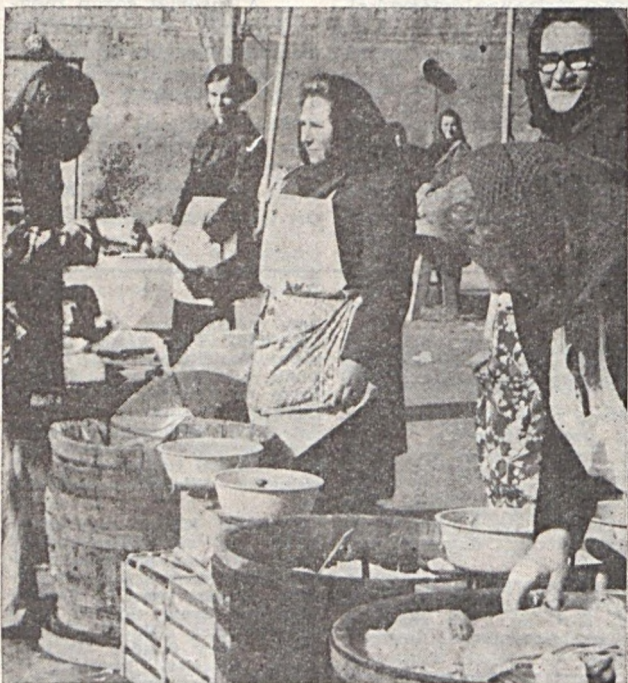
A tavasz fátáradtságot előidéző vitaminhiány leküzdésére hordóskáposzta formájában C-vitamin minden mennyiségben kapható a pécsi piacon.

A KORÁBBI híradásunktól eltérően nem április 10-én, hanem április 24-én 19 órakor lesz a Pécsi Nemzeti Színházban a Magyar Néphadsereg Központi Fúvószenekarának és vállalatunk fúvószenekarának közös hangversenye.