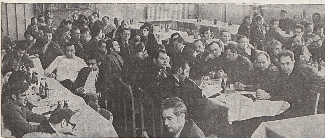
A vállalati brigádvezetői értekezlet résztvevőinek egy csoportja.