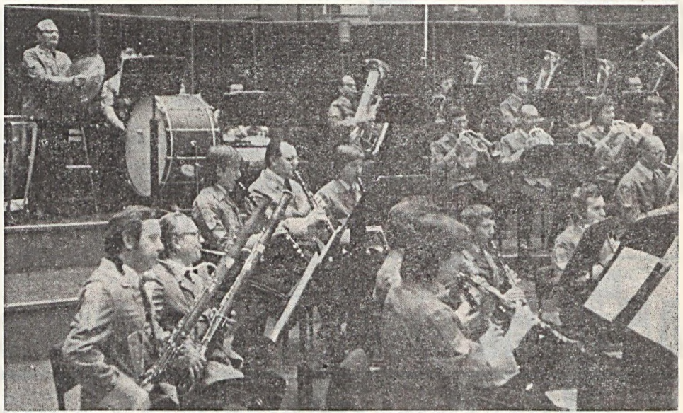
Vállalati fúvószenekarunk hangfelvétel céljából ismét meghívást kapott a Magyar Rádió 6-os stúdiójába. Öt autóbusszal szállította a zenekari tagokat és az érdeklődőket Budapestre. Felvételünk a stúdióban készült.