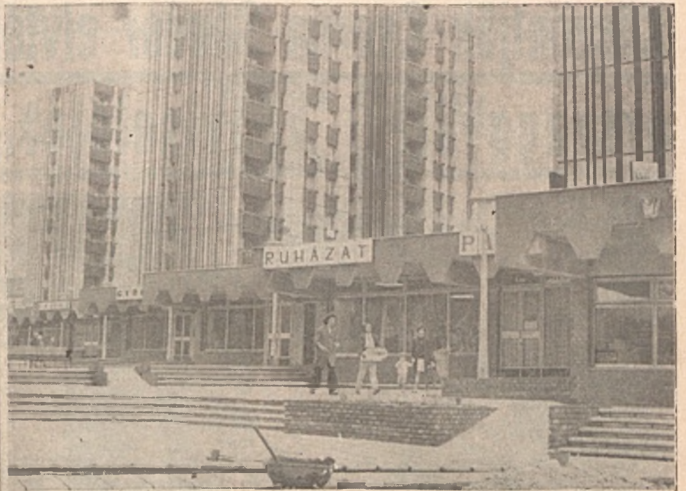
A lebontott régi lakóházak színhelyén gyorsan fejlődik a Szigeti városrész. Képünkön a Rókus utca lakóépületei és üzletsora.

Feladatok a szakszervezeti választások után