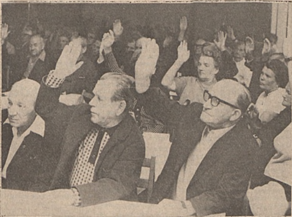
Vállalatunknál lezajlottak a szakszervezet nyugdíjas alapszervezeti vezetőségeinek választási taggyűlései. Képünkön a központ nyugdíjas alapszervezetének taggyűlése a Ságvári Endre Művelődési Házban.