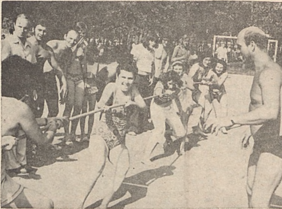
Ki tudja, meddig húzhatod!? Pillanatkép a női kötélhúzás döntőjéről. A győztes csapat a kép jobb oldalán.

Szerkesztői üzenet. A szerkesztő bizottság a legközelebbi ülését július 23-án 14,30 órakor tartja a munkásszálló magyaros szobájában.