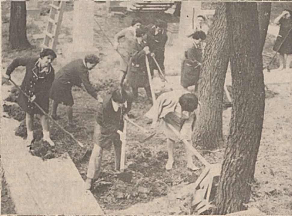
Felvételünk a Központ munkásellátási csoportja által szervezett és a mohácsi vízitelepen végzett társadalmi munkáról készült. A takarítószemélyzetből és iparőrökből álló csoport a hétvégi üdülőhelyen tereprendezést és parkosítást végzett.