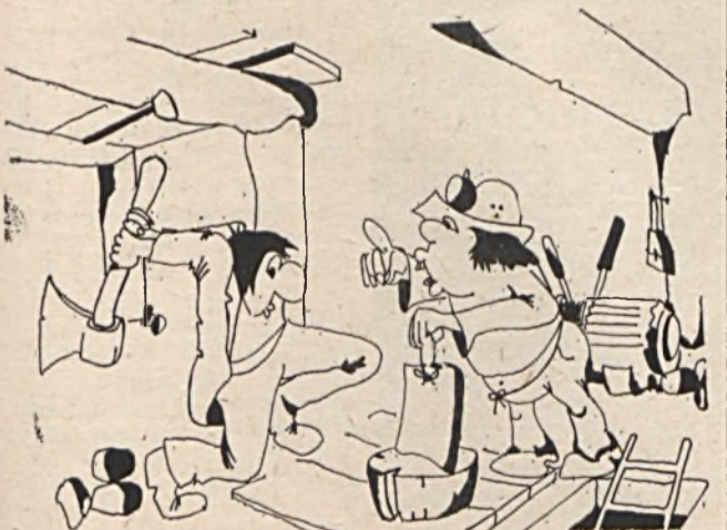
Védőreggeli: — Kösörűld meg a baltát, mert szalonnát vágunk! (Szarka Tibor)