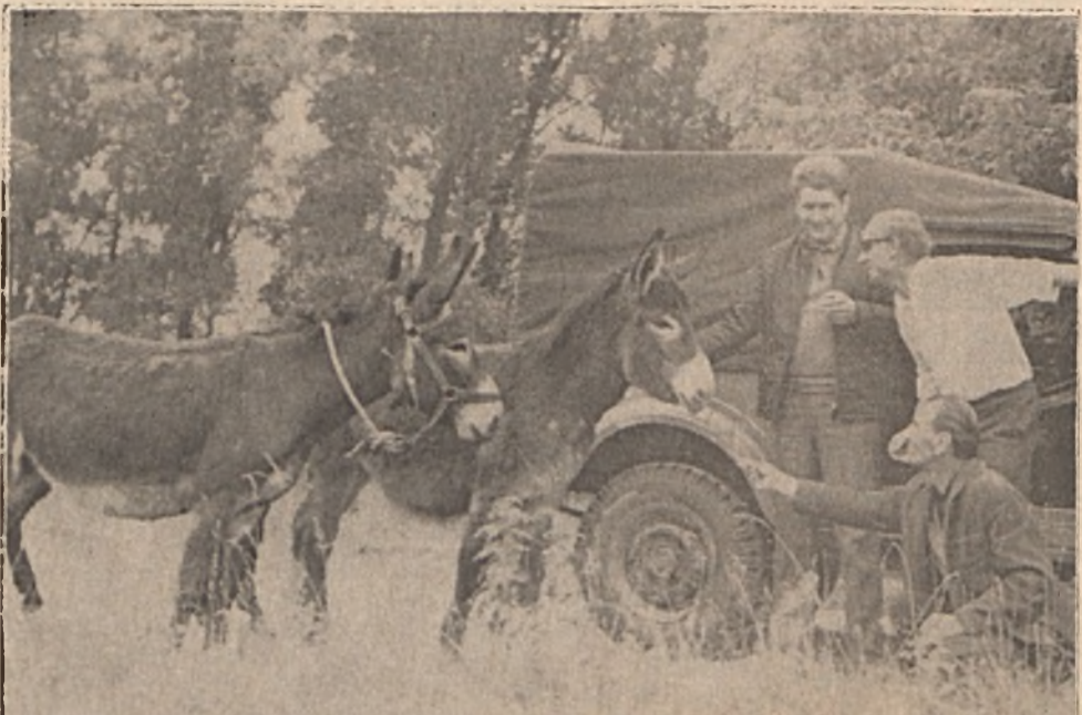
A Gaz terepjáró utasai ismerkednek Moháccszigeten.