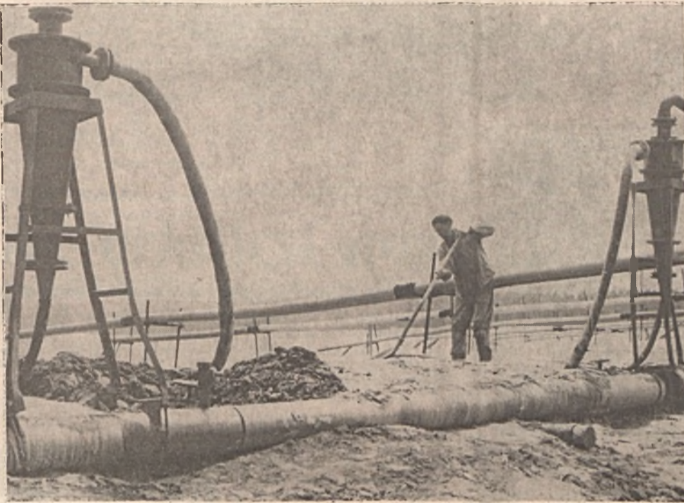
Hidrociklonnal leválasztott homokgát öleli körül az EDÜ zagytároló „tavát”, ahol jó és rossz időben állandó jelleggel dolgoznak a gátepítők.