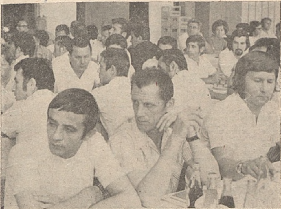
A küldöttek egy csoportja a felszólalásokat hallgatja.