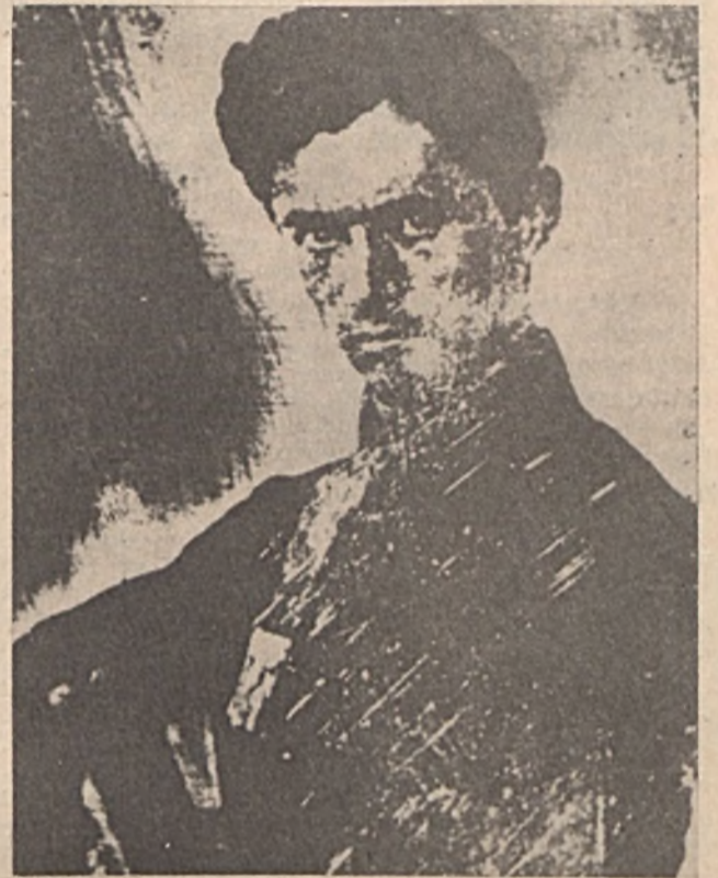
Petőfi Sándor egyetlen hiteles dagerrotíp felvétele, amely feltehetően 1847-ben készült. Az eredetijét, mely alig nagyobb egy gyufásdoboznál a Petőfi Múzeumban őrzik.