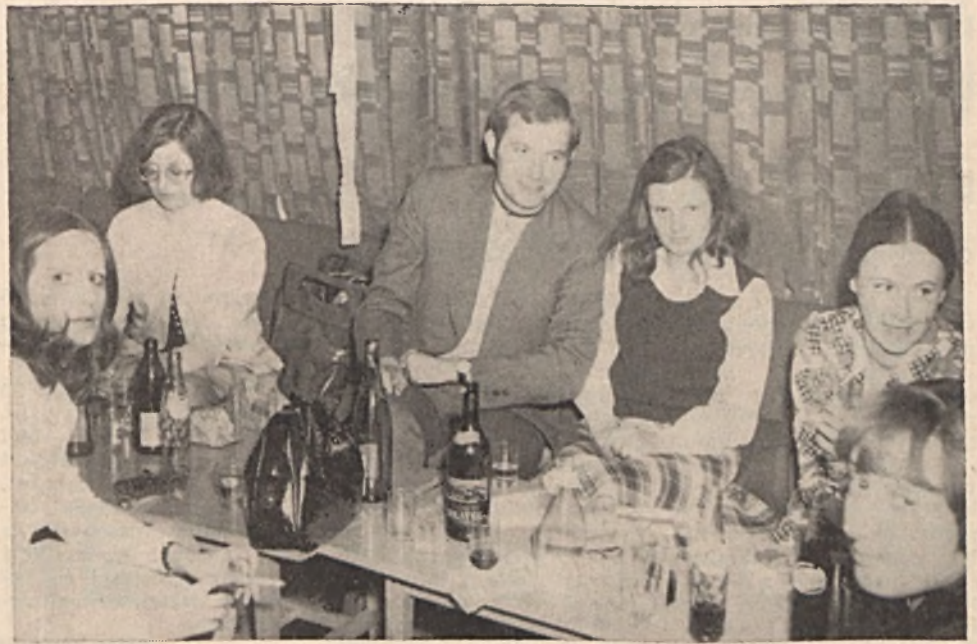
Február 22-én a KISZ-klubban jól sikerült farsangi klubestet rendezett a Kutató-mélyfúró üzem KISZ-szervezete. A zene és a hangulat kitünő volt. Este nyolcig még az ifjú mamák, papák is ott voltak, kisgyermekük is remekül érezték magukat a barátságos hangulatú körben.