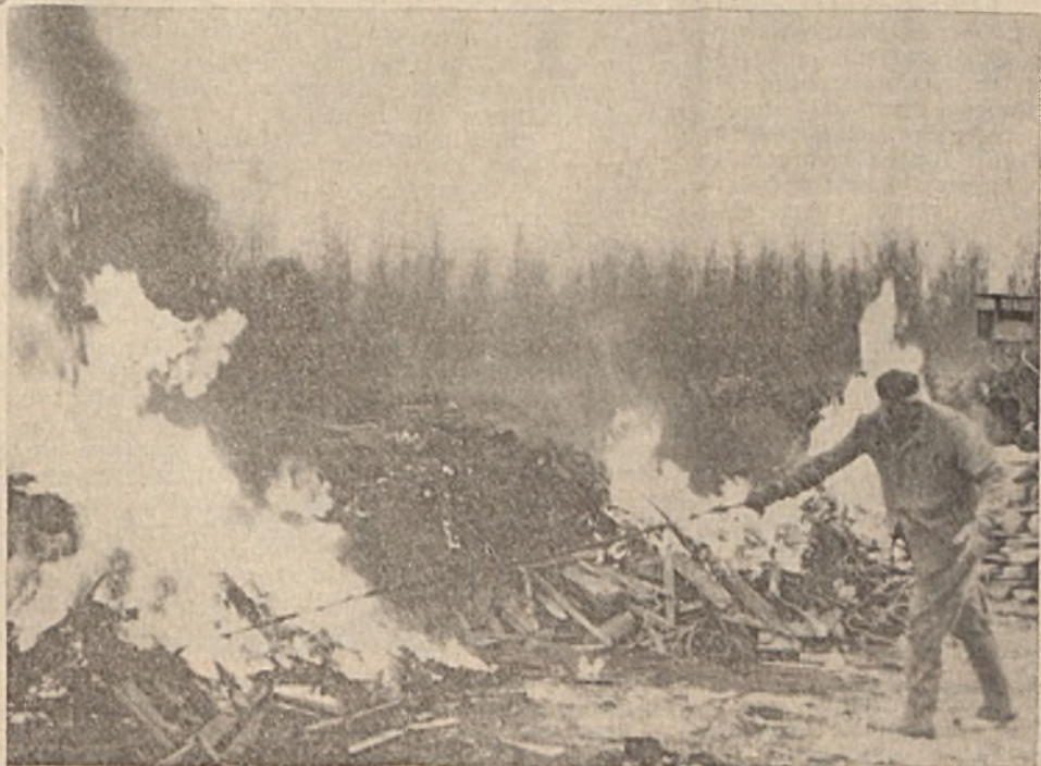
A bányászemekből szállított érccel együtt sok hulladék faanyag is lekerül az Ércdúsító üzem ércosztályozójához. A kiválogatott és még hasznosítható faanyagot lemosásuk után az üzem dolgozói mázsánként tíz, illetve harminc fontos áron megvásárolhatják. A törmelék az üzem égetőhelyén eltűzlik. Képiükön égetik a hulladék fát.