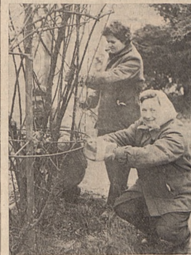
A kertészeti dolgozói a jó időt kihasználva már a kora tavaszi munkákat — fák, díszcserjék, bokrok metszését — végzik az EDÜ parkjában.