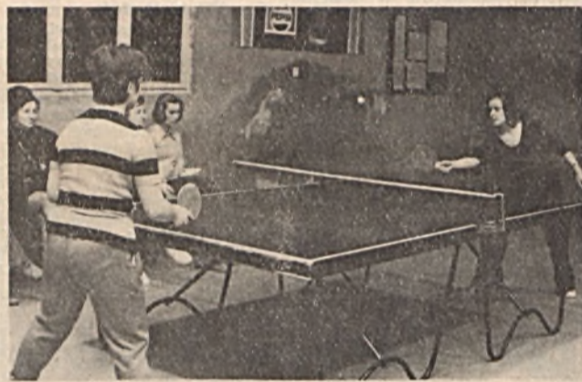
Megkezdődött vállalatunknál a női asztalitenisz-bajnokság