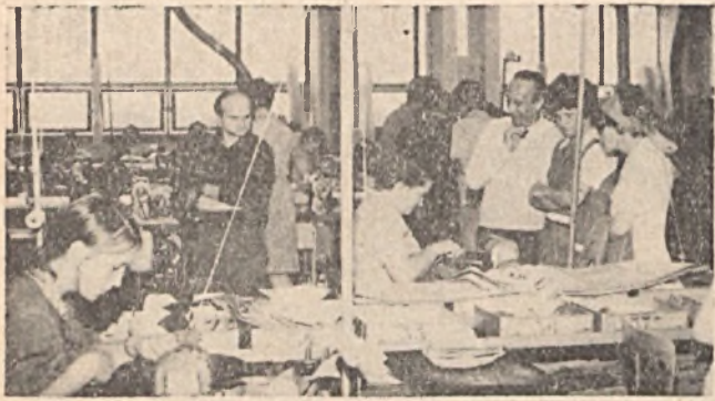
Az ÉDÜ szakszervezeti bizottsága tanulmányi kirándulást szervezett Bonyhádra, ahol a résztvevők megtekintették a Zománcipari Műveket és a Cipőgyárat. Felvételünk a Cipőgyárban készült