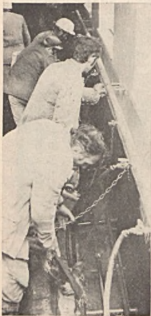
Vége egy műszaknak. A napszintre érkezett bányászok fáradtan, de a jól végzett munka tudatában tisztítják csizmáikat a II. sz. bányüzem csizmamosójában