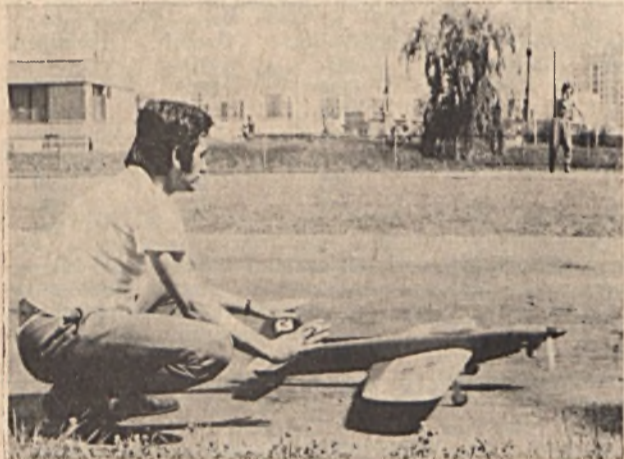
Befejeződött az MHSZ—Ércbányász modellező-pályán lebonyolított VII. Mecsek Kupa nemzetközi körrepülő modellező verseny. Felvételünkön műrepülő rajtot láthatunk