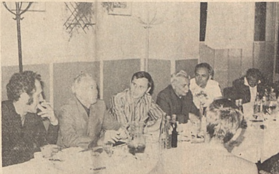
A vállalati szakszervezeti bizottság július 26-án kihelyezett ülésen a II. sz. bányüzemben tárgyalta meg az üzem bérgházalkodását, valamint a kongresszusi munkaverseny helyzetét.