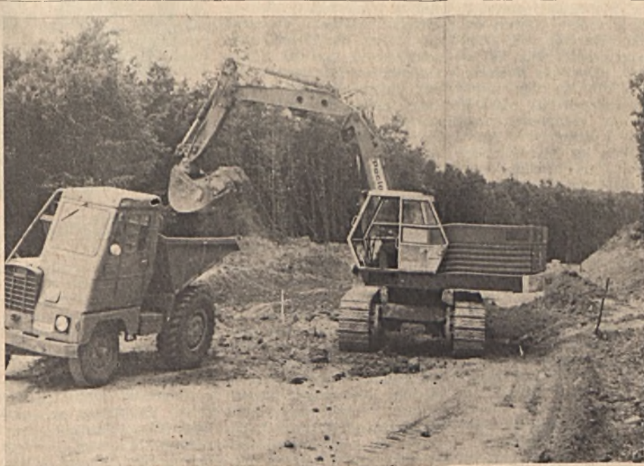
Ügyes, fürgé gépek könnyítik az útépítők munkáját a „Gesztenyében”, az V. sz. bányauzemhez készülő műút építésében