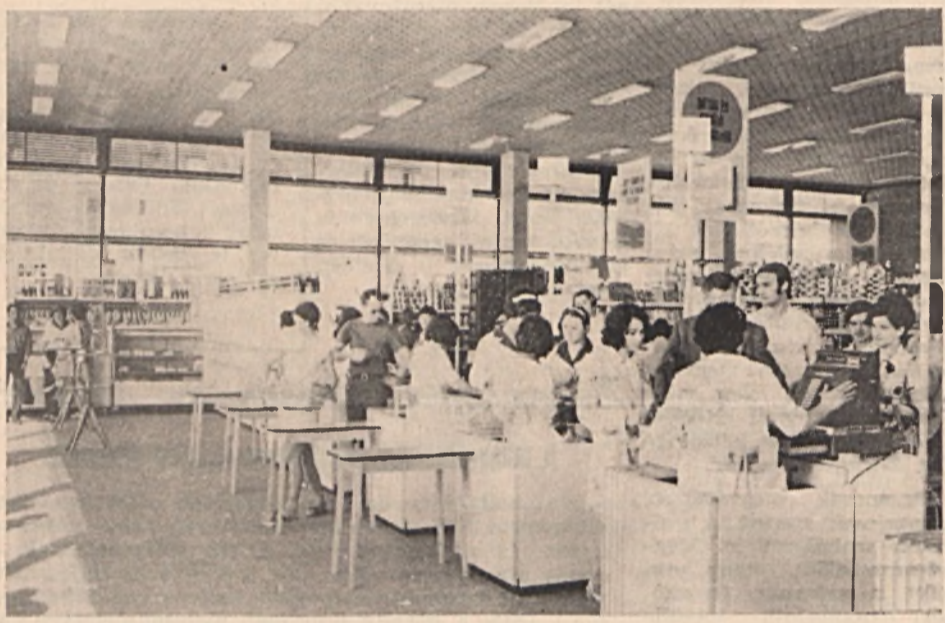
A közelmúltban avatták fel Ujmecsekálját és egyben a megye legnagyobb ABC áruházát. Az új szupermarket első napi forgalma 270 ezer forint volt