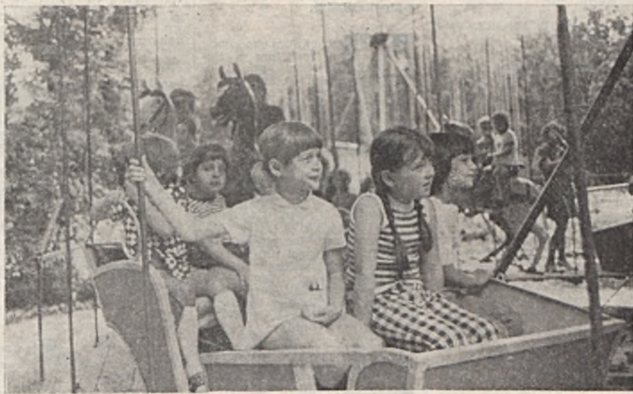
A Mecseki Kultúrpark és a Szolgáltató üzem között létrejött együttműködési megállapodás értelmében az üzem által patronált Karikás Frigyes utcai IV. sz. óvoda 126 kis lakója önfelédtt vidámsággal vette birtokába egy napsütéses délelőttre a Mecseki Állatkert és Vidámparkot. Mosolygó arcocskájuk elárja, hogy kellemes délelőtt volt, jól játszottak