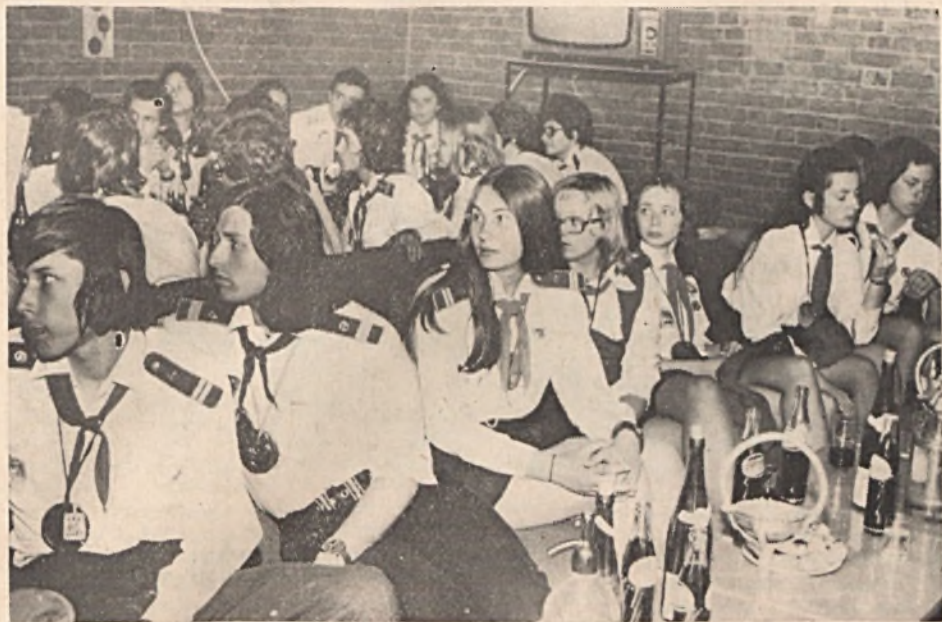
Baráti találkozón vettek részt a Mecseki Ércbányászati Vállalat ifjúsági klubjában az Országos Ifjúvezetők Parlamentjének Pest, Borsod, Veszprém és Zala megye csoportjai, ahol a MÉV, a VOLÁN és a MÁV KISZ-csival ismerkedtek