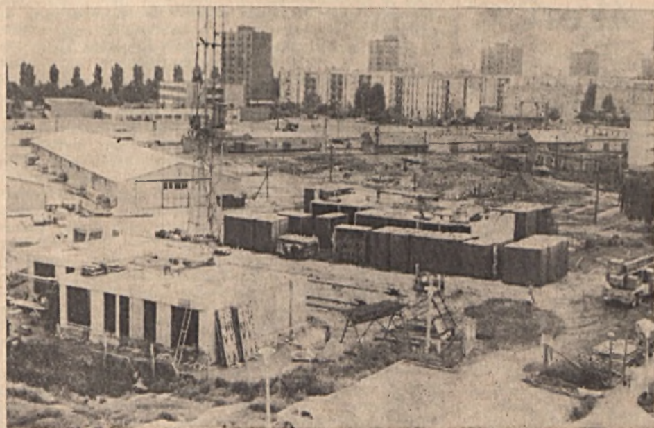
Épülnek az új mecsekaljai Ércbányász Munkáslakás-építő és Fenntartó Szövetkezet tízemeletes tévé háza. Az építők már a 200 és 201-es épületek első szintjén munkálkodnak

A párt-végrehajtóbizottság megállapította, hogy az ifjúságpolitikai határozat vállalati végrehajtását többségében jó eredmények fémjelzik. Ugyanakkor felszínre hozta munkánk gyenge oldalait is, és a tennivalókat állásfoglalásban rögzítette.