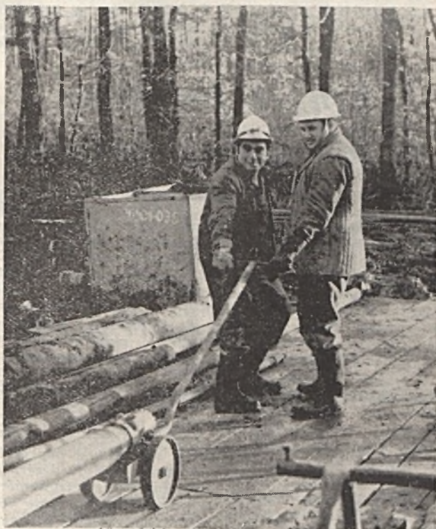
Fúrószerzős klépítése

Tavaly augusztus óta folyik a koncentráltabb munka a körülbelül egy négyzetkilométernyi területen. A különböző kutatási ágak — geológiai, geofizikai, geodéziai, fúrás — felvonulása példátlan munkaszervezést követelt. A terpei geológiai és geofizikai munkák és húsznál több sekélyfúrás eredményeképpen új, az addigieknél tökéletesebb földtani térkép és szelvények születtek, ezek alapján már ki lehetett jelölni a két mélyfúrás, az új akna helyét. Itt dolgozott a világviszonylatban is a legmodernebb fúróberendezés-ként számoltartott Longyear köteles magfúró berendezés, amely szinte végig százszázalékos magot, kőzetmintákat hozott fel a föld mélyéből. E gép a Kutató-mélyfúró üzem műszaki fejlesztésében a legnagyobb eredmény.