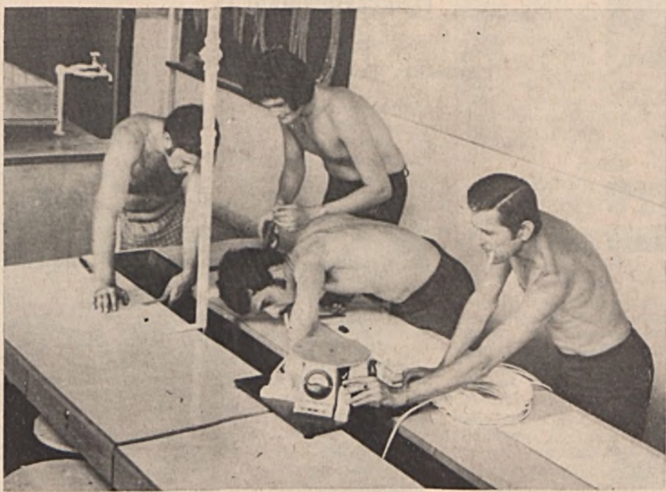
Az EDU Dinamó szocialista brigádja az üzemben készített feszültségelosztó és szabályozó szekrény szerelési munkálatait végzi a patronált Bánki Donát utcai Általános Iskola fizikai előadójában