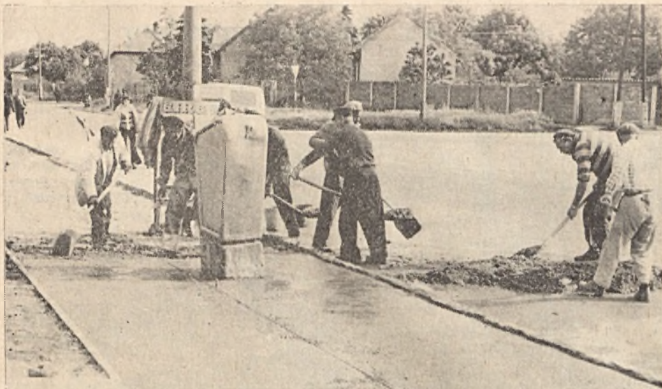
Képünkön még betonozzák az újmecsekaljai autóbusz-végállomással szemközt járdát a tanács költségvetési üzemének dolgozói. A gyalogjárda átadásával megszűnt a balesetveszély