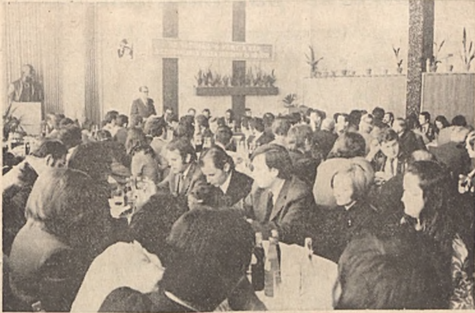
Az ifjúsági parlament résztvevői feszült figyelemmel hallgatták Tóka elvtárs beszámolóját az ifjúsági törvény végrehajtásáról