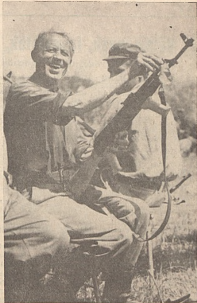
A Pécs városi-járási munkásörsg 1974. május 24-27 között koncentrált kiképzést tartott. A kiképzés során munkásörscink bebizonyították, hogy munkájuk mellett a párt által rájuk bízott és önként vállalt munkásörsi feladatokat is becsületesen és lelkiismeretesen végre tudják hajtani. A kiképzés utolsó fázisa a lövészet volt. Felvételünk a lövészet utáni karbantartás egyik pillanatát örökítette meg. A képről is leolvasható, hogy a lövészet jól sikerült