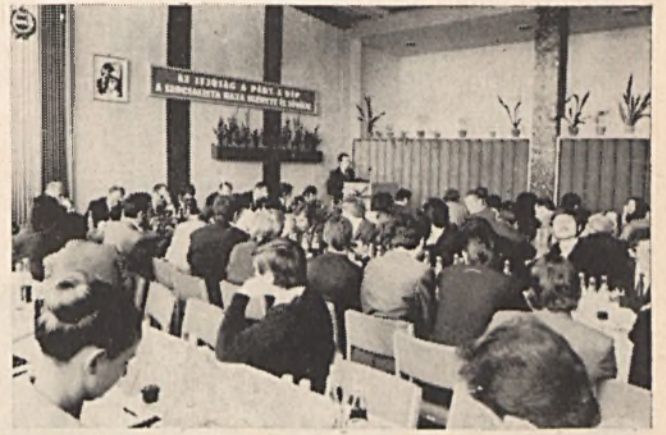
Tóka Gyula, a IV. sz. bányauzem küldötte, az ifjúsági törvény adta lehetőségek kihasználásáról beszélt

— Sok felszólaló foglalkozott az ifjúsági klub problémáival. Meg kell oldani és felszámolni a klub-komplexum kocsmá jelle-