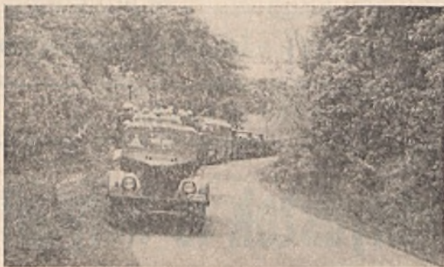
Pv-egység bevetésre indul

— PV szervezetek létrehozása, felkészítése, anyagi, műszaki ellátása, működtetése,