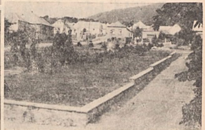
Kővágószőlős centruma a szép, gondozott és tiszta Hősök tere

A spanyol furcsaságok között a legjellegzetesebb a bikaviadal. Állítólag már a mór hódítás idején is játszották és azóta elterjedt szinte valamennyi latin nyelvcsaláddal tartozó országban. Mindmáig a legvadabb formáját Spanyolországban játsszák. Míg másutt fakardokkal vívják a küzdelmet, spanyolhonban „a bikának meg kell halnia”. Minden városban nagy köralakú épületek, arénák vannak, melyekbe 20–30, de esetenként 80 ezer ember is befér. A közönség között egészen apró gyerekek is helyet foglalnak, nem csoda hát, hogy minden spanyol született szakértője ennek a küzdelmeknek. A játékok másodpercre pontosan kezdik. Pattogó ritmusu muzsikát játszik a zenekar, melyre bevonulnak a viadal segédei és a főszereplők, a törérók és matadorok. A bevonulás után elcsendesedik az aréna, körülzárlás hallatszik, félrerántanak egy ajtót és berobban egy bika, mely kisebb a miénkénél, színe általában fekete, rendkívül gyors és dühös. Ez a düh érthető, hiszen a viadal előtt huszonnégy órával már nem kap enni és sötétben tartják, hogy minél vadabban lépjen a küzdőterre. Most lándzsások rohannak be, akik hegyes, színesnyelű lándzsákat döfnek a bika hátába, egyrészt, hogy vadítsák, másrészt, hogy a folyamatosan ömlő vérről meggyengítsék az állatot. Bőrpáncélba öltözött lóval egy lovas is bejön, magára vonja a bika figyelmét, a bika öklelni próbálja a lovat és ezáltal tovább veszt erejéből. Ezután ki megy mindenki a porondról és bejön a matador. Ruhája csodálatosan színes, tele van arany sűjtá-