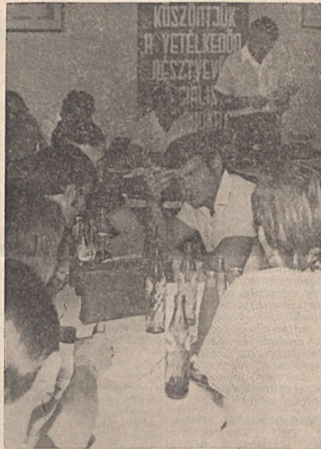
Pillanatkép a IV. sz. bányauzemi szocialista brigádok vetélkedőjéről