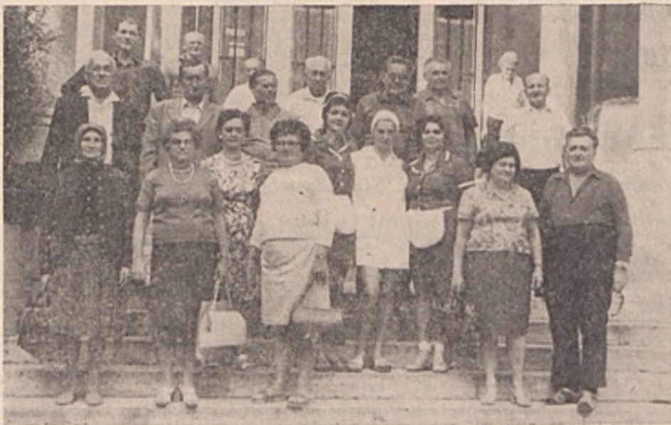
Nyugdíjasaink 54 fős csoportja kellemes hetet pihent Balatonfüreden, a vállalat üdülőjében. A szakszervezeti alapszervezet a térítési díj ötven százalékát, valamint az ismerkedési és búcsú est vendéglátási költségét térítette. Felvételünkön a haza indulók egy csoportja látható