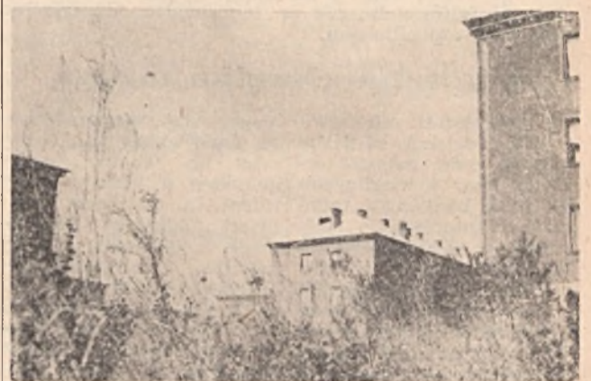
Ez itt Ujtelep!? De hol van? Lecsúszott? Így is mondhatnánk, mert a helyenként méteres gáztól alig látni e „szép lehetne” települést