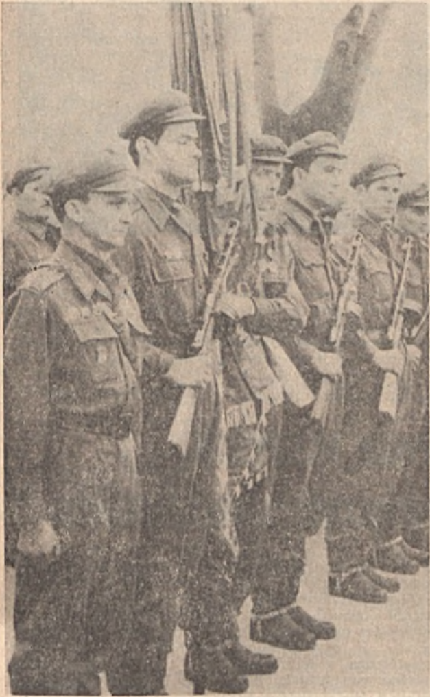
Munkásör díszszakasz az egység csapatszázlójával

Minden esztendőben szeptember 29-én — az 1848—49-es szabadságharc dicső győzelmével befejeződött pátkozdi csata évfordulóján — dolgozó népünk őszinte megbecsüléssel és szeretettel köszönti azokat, akik fegyverrel a kézben mindig készen állnak szocialista hazánk békéjének, függetlenségének, népünk alkotó munkájának védelmére.