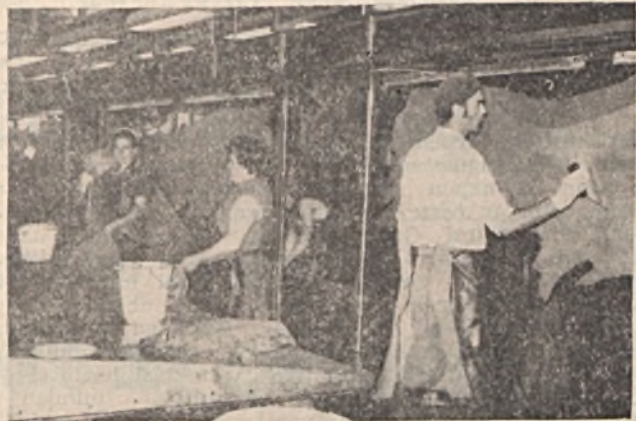
Az alagútszerű szárításnál felragasztják a bőröket

A gyártelep az egykori Postavölgy (ma Siklósi út) útvonala mellett fekszik. 1889-ben árverésen vették meg Höflerék a volt Madarász-téle vasgyárat, mert a Rákóczi úti manufaktúra már nem elégítette ki a termelés követelményeit. A gyártelepen ekkor négy épület állt, s ilyen helyi adottságok mellett már új módszerrel, a kapitalista fejlődésnek megfelelően foghattak hozzá a termelés megszervezéséhez. Üzemi célokra először a belső két nagy épületet rendezték be. Itt működött az első gőzgép, amely megteremtette a termelés gépesítésének alapját és új fejezetet nyitott a pécsi börgyártás és egyben a pécsi iparfejlesztés történetében. Budapesten a milleneumi kiállításra már a magyar bőrpar nagy haladása volt látható, amelyhez a pécsi gyár termékei is hozzájárultak. 1907-ben az országban talán elsőként kezdték a borjúbőrbőr gyártását is. 1912-ben (sok adósságuk miatt) részvénytársasággá alakultak. Az 1932. évi budapesti bőrpari nemzetközi vásáron elismerést arattak a gyár termékei: a