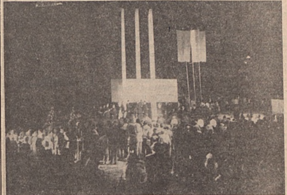
Koszorúzás Csertetőn; Emlékezés és tisztelet hős elődeink emlékműve előtt

A vetélkedő a legjobbak részére nemcsak a baleseti előírások felfrissítését