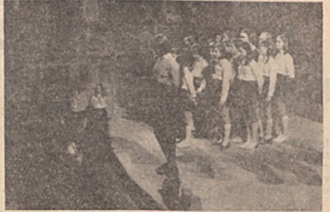
Ujmecekalja iskolának úttörő küldöttsége verssel, dallal köszönti dolgozóinkat