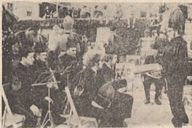
A katowicei Michal bánya fúvószenekara a Széchenyi téren