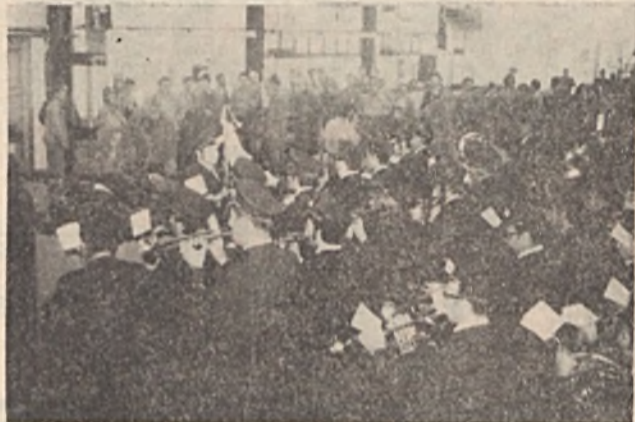
Vállalatunk fúvószenekara köszönti a IV. sz. bányáüzem dolgozóit