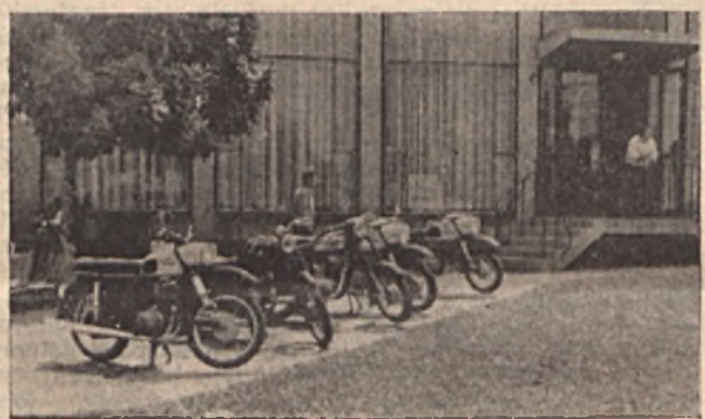
A munkásszálló előtt elhelyezett motorok egy kicsit rontják a térség képét. A túlsó oldalon egyébként parkolóhely van kialakítva