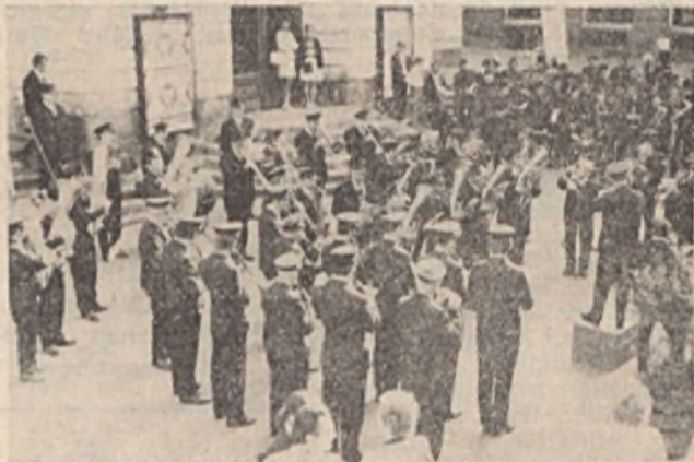
A salzburgi vasutas fúvószenekar ténzenét ad a Színház téren, háttérben vállalati zenekarunk