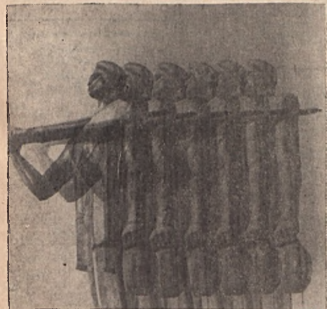
Trécsi szaki Újév napján: — Ni csak, szoborcsoport a Központ előtt! Krucsek szaki: — Ne nézz arra pajtás! Untig elég abból egyet látni.