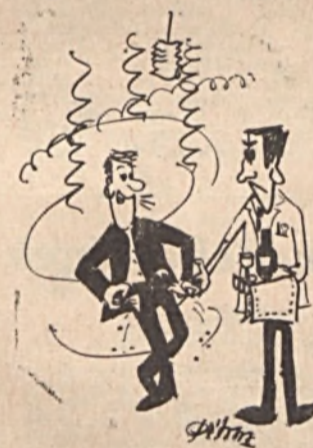
VÁLSÁGOS PILLANAT: „Pincérkém”! Mi lenne ha fizetés helyett mondjuk egy nagyon BOLDOG ÚJÉVET kívánnék?!