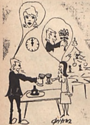
SZILVESZTERI KÁBITÁS: Lujzikám! Fogadom, hogy mától új életet kezdtek!