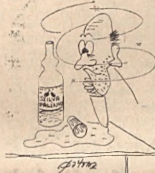
HALUCINÁCIÓ: Lenyeltem a magot is.