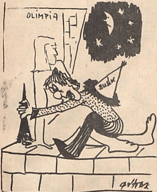
DELIRIUM TREMENS ... „Drága kis feleségem” Igérem, soha többé nem iszom, csak ne légy hozzám ilyen hideg.