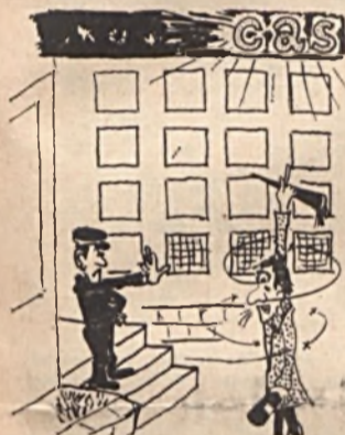
OPTIKAI CSALÓDÁS: ... Ne akarjon átverni, hogy ez nem egy CASINO!