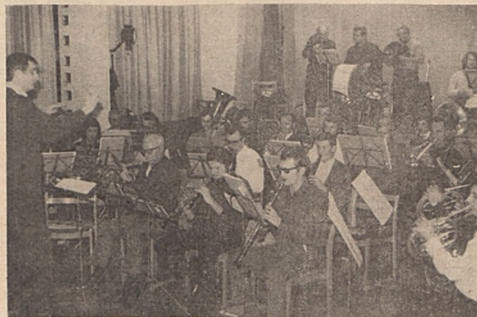
Vállalatunk fúvószenekara a Ságvári Endre Művelődési Házban gyakorol