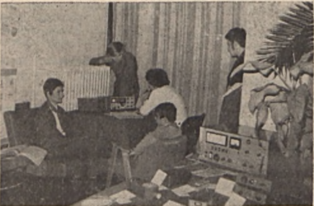
A munkásszálló halljában bemutató forgalmazást tartott a HA 3 KMK kollektív rádióállomás