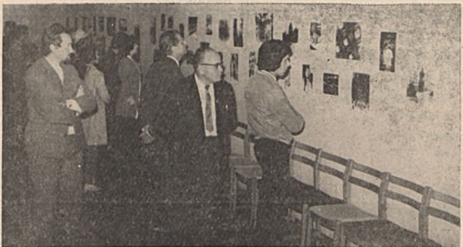
A bányász kulturális napok keretében fotokiállítás nyílt a Ságvári Endre Művelődési Házban.