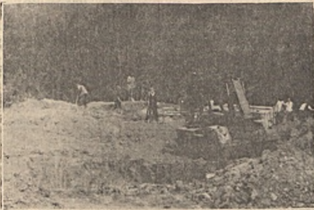
Segít a gép