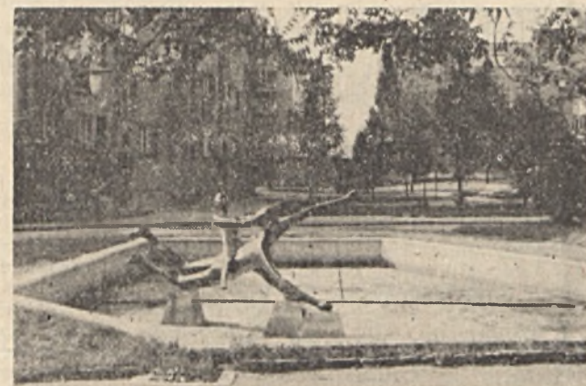
FÜRDŐZŐ LÁNYOK — VÍZ NÉLKÜL

A Körösi Csoma Sándor utca hangulatos parkját nyánának képét nagyon rontja a víz nélküli szoborosport és szökőkút. Az alkotó, Labor Ferenc, bizonyára nem így képzelte el, de mi, lakók sem.