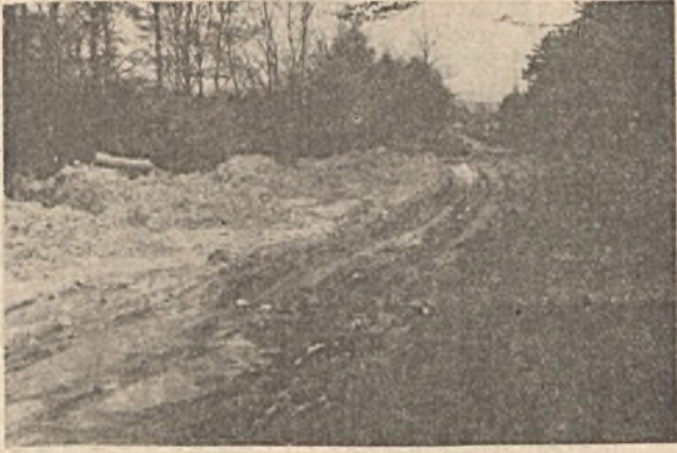
Egy nyomon járható út a légaknához