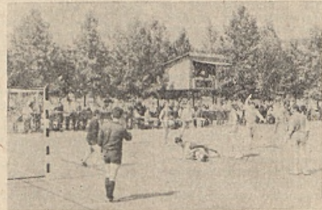
Folytatja sikeres szereplését az NB I. B-ben az Ércbányász kézilabda csapata. Ércbányász—Miskolci Bányász mérkőzésen a hazaluk 24:21 arányban győztek.