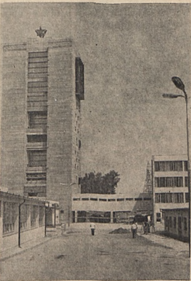
Az elkészült aknatorony