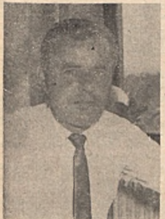
Szabó Jenő II.