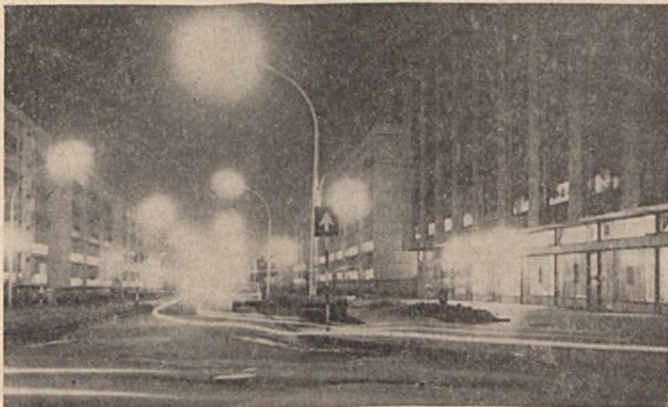
ESTI FÉNYEK ÚJMECSEKALJÁN

Vállalatunk KISZ-fiataljainak 27 fős csoportja 4 napon keresztül részt vett a Dráva-menti árvízvédelmi munkákban. A Dráva-szabos mellett gyűrűs-pusztai szakaszon kapcsolódtak a víz elleni küzdelembe.