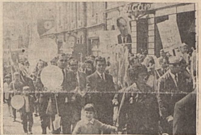
A II. üzem