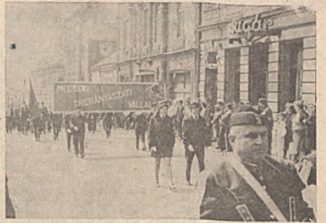
A hagyományoknak megfelelően dolgozóink az idei május 1-i felvonuláson is nagyszámban vettek részt. Különösen nagy sikert aratott az új egyenruhában vonuló fúvószenekarunk.

Az elvtársaknak a polgári védelem érdekében kifejtett példamutató munkájukhoz erőt, egészséget kívánunk.