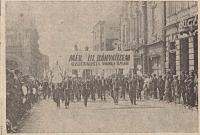
A III. üzem