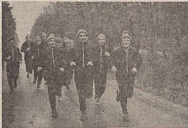
Edzenek az Ércbányász labdarúgói.