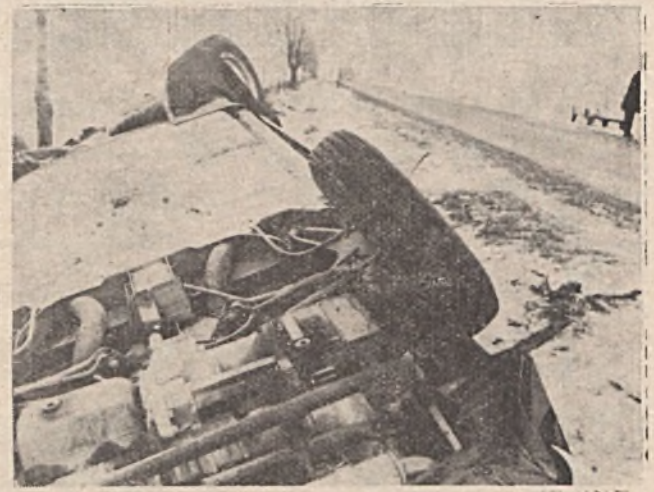
Egy szerencsés kimenetelű gyorsajtásból eredő baleset (a baleset során csak könnyű sérülés történt).

Tehát a jármű sebességét úgy kell megválasztani, hogy az megfeleljen a látási-, forgalmi- és útviszonyoknak és ne igényeljen nagyobb féktávolságot mint amekkora a belátható út-