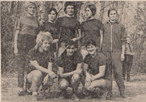
A nagy népszerűségnek örvendő női labdarúgásnak már vállalatunknál is vannak követői. Képünkön az EDÜ labdarúgó csapat tagjai láthatók a Kis.-Kut. csapatával történi mérkőzés előtt

November 13-án „November 7.” kispályás labdarúgó kupa döntő