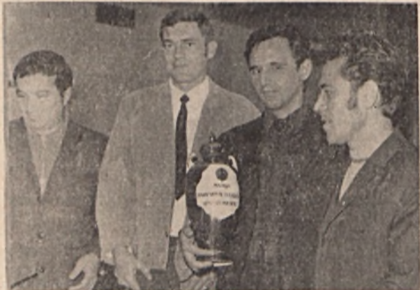
Országos Bányász Lövészverseny, a MEV győztes csapata