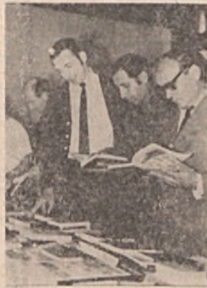
Műszaki könyvkiállítás a központban