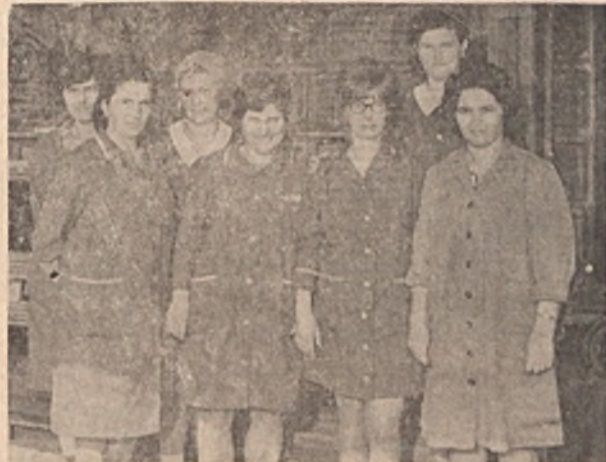
Az EDÜ Beloianisz női szocialista brigádja