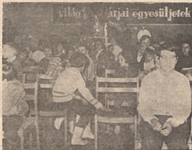
December 22-én az igazgatóság nőbizottsága ez alkalommal is megrendezte a gyermekek között nagy népszerűségnek örvendő filmvetítéssel egybekötött karácsonyfa ünnepséget.

Vállalatunk 1971. évre is megkötötte az NDK cseré-üldetési szerződését. Dolgozóink a következő helyeken és turnusokban üldülhetnek: Steinbach: március 8-tól 22-ig; Schwarzburg: május 27-től június 10-ig; Zinnowitz: június 30-tól július 14-ig, július 14-től jú-