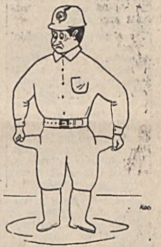
Tela a fejem, üres a zsebem