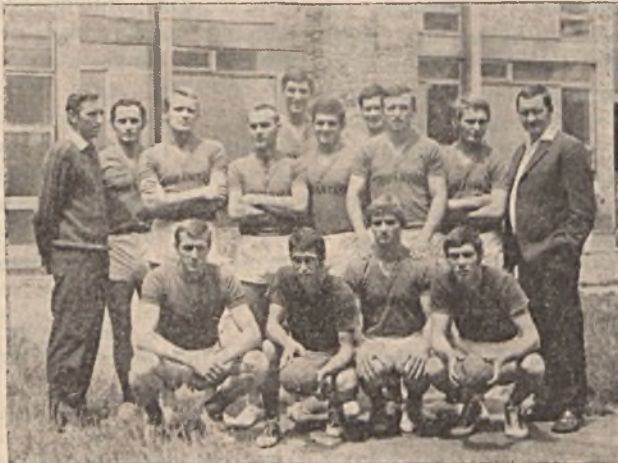
Akikre büszkék lehetünk.

A Pécsi Ércbányász kézilabda szakosztálya fennállása óta az idej MNK-ban való szereplésével érte el a legjobb eredményét. Nagyon kevés NB II-es csapat vallhat magáénak ilyen ritka bravúros teljesítmény sorozatot, mint az Ércbányász csapata. Az első fordulóban a Tatabányai Bányász ellen diadalmaskodtak! Ezt követően Z. Honvéd elleni 29:17-es fölényes győzelem előre sejtette a siker-sorozatot. Ezt követően az NB I. B kitűnőségét, az FTC-t győzte le magabiztosan 17:13 arányban. A legjobb nyolc között ismét egy erős csapatot kaptak ellenfélül, az NB I-es Székesfehérvári Szondit, amelyet 22:14 arányban győztek le Ujmecekalján.