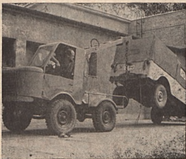
„Holdkomp” nevet kapta a Szolgáltató Üzem dolgozói által készített furgé, ügyes kis motoros vontató, amely munkájukat könnyíti.