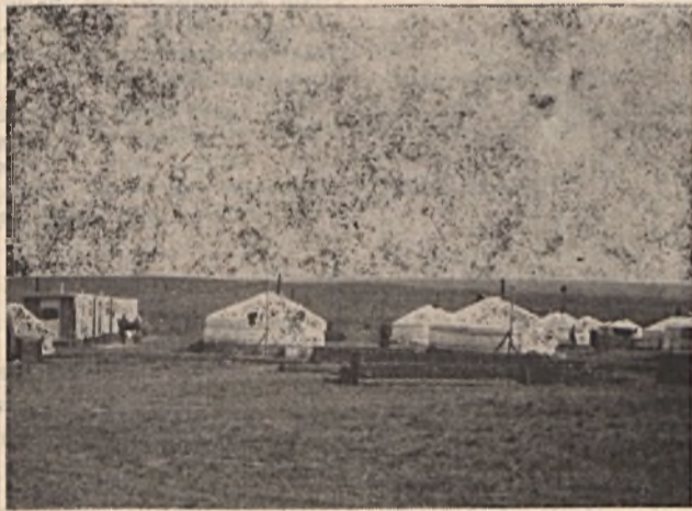
Magyar Kutató Expedíció tábora Kelet-Mongóliában

Szánbájno! Ilyen köszöntéssel fogadják a messzi Kelet felé utazó vándort a mongol határőrök és vámosok, amikor Szuh-Bátornál átlépi a mongol határt, ráadásul még keleti mosolyt is varázsolnak hozzá. Az ember mindenhol, a nap minden szakában ezt a köszönést hallja, ami annyit jelent, mint nálunk „jó napot!”.