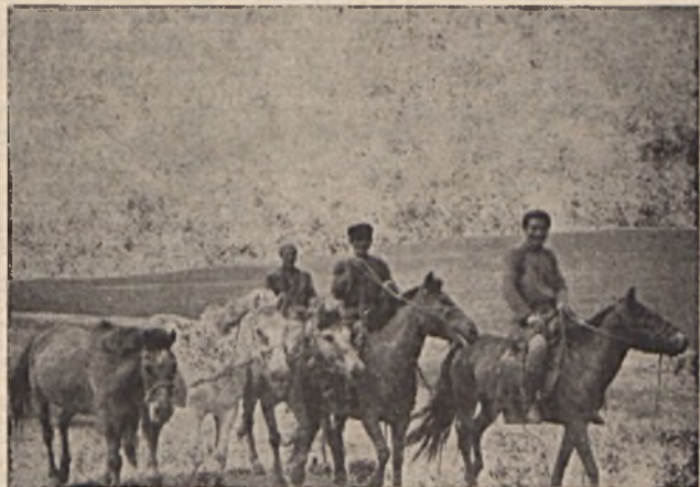
Más füves részre költözik a család. A család férfi-tagjai elől lovagolnak.