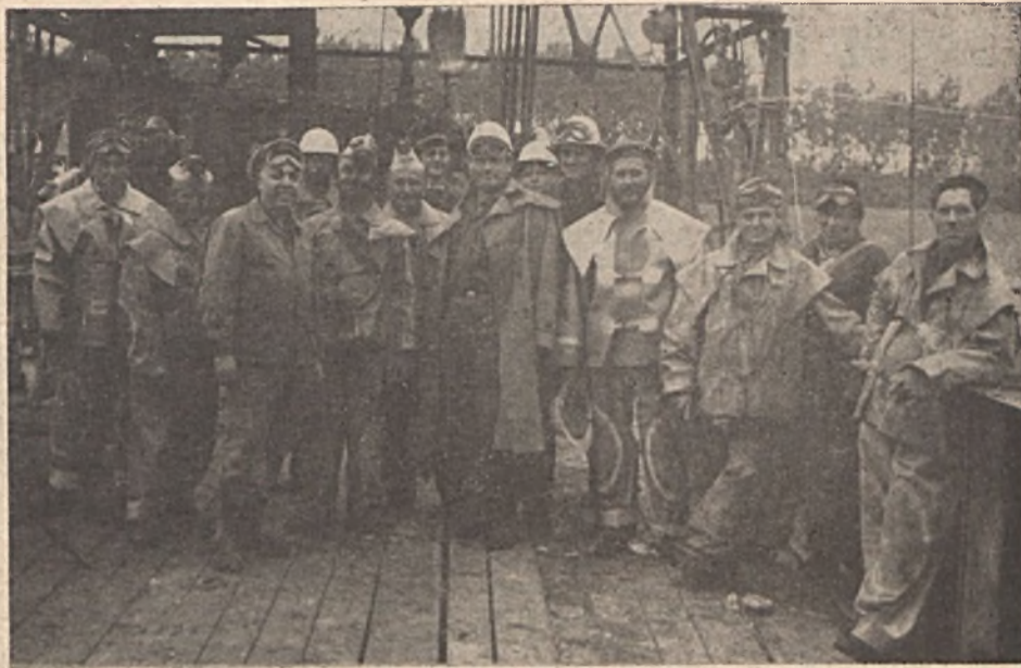
A savazó brigád

Az újpetrei termelőszövetkezetet a komoly eredményt elérték között emlegetik Baranyában. Szépen gondozott, jól termő földje, kiváló állatállománya, külföldi kereskedelmi kapcsolatai példaképpül szolgálhat sok tsz előtt. A tsz majorja az állandó változás képét mutatja, új istálló, ólak, műhelyek épülnek. De a fejlesztést akadályozta a vízhiány. Egy kis ástott kút nem tudta táplálni a hidrogénbust. Fúrt kút kellett tehát! A MÉV Kutató Mélyfúró Üzemének szakemberei az eddigi kutatási eredmények birtokában nyugodtan mondhatták, hogy minden lehetőség megvan a sikeres vízfúrásához. Megkötötték tehát a szerződést a kút lemélyítésére.