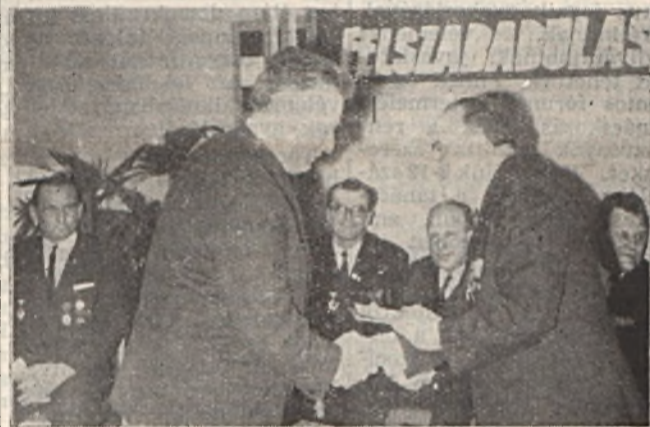
Kitüntetések, jutalmak a legjobbakkak.

A Munkás-Paraszt Forradalmi Kormány Elnöksége és a nehézipari miniszter elvtárs felszabadulásunk 25. évfordulója alkalmából vállalatunk számos dolgozóját tüntette ki.