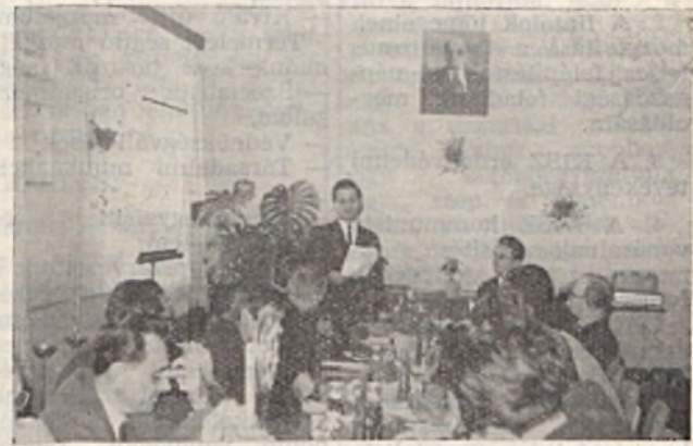
A vállalati agitációs felelősök tapasztalatszerével egybekötött értekezletet tartottak Bakonyán