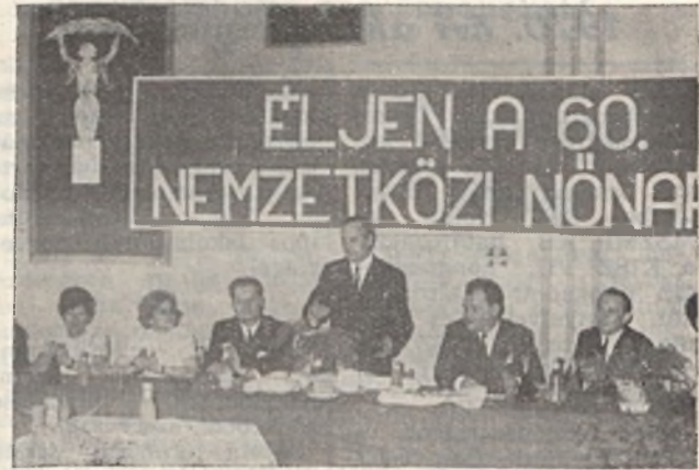
Nödlgozóink köszöntése a nemzetközi nőnap alkalmából