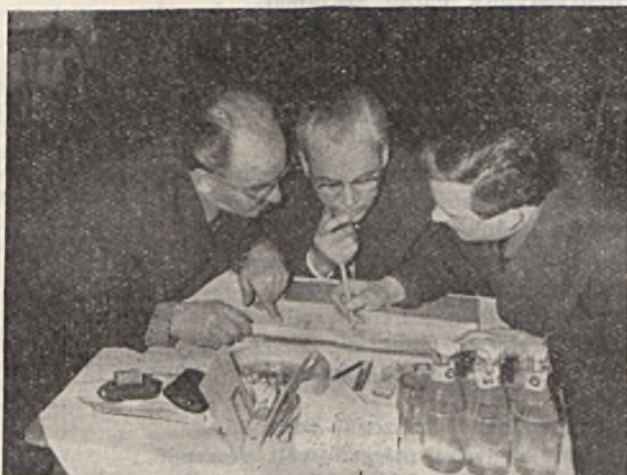
Csapatok a középdöntőben