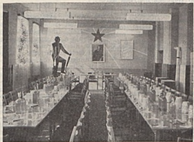
Új kulturális helyiséget avattak az Anyag- és Áruforgalmi Főosztály dolgozói