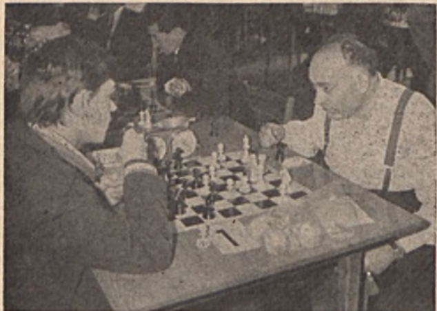
Nem sikerült a rangadót megnyerni. Tűzoltó Dózsa – Ércbányász 6,5:3,5.