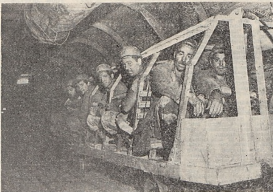
Képünkön: a népeskocsi meredek emelkedőn viszi a csapatot.