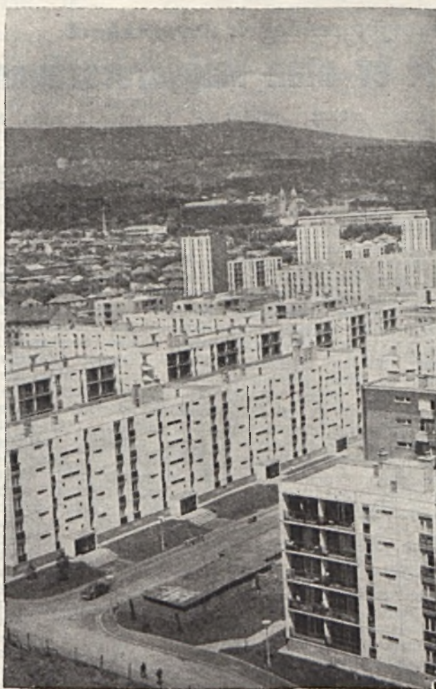
Kilátás az épülő 17 szintes épületből Újmecekaljára.