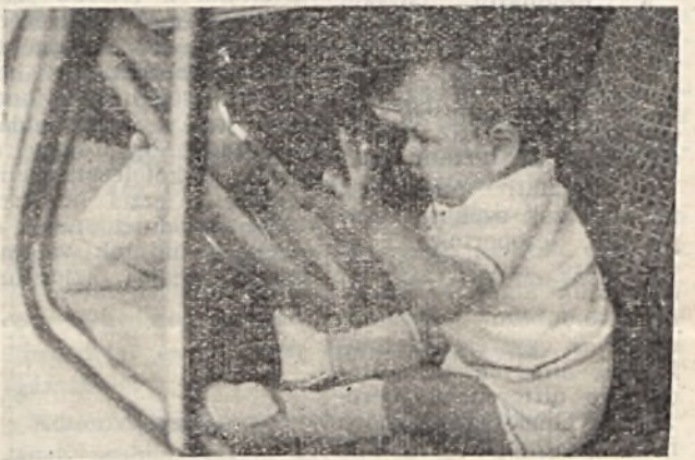
Végre a volánnál!