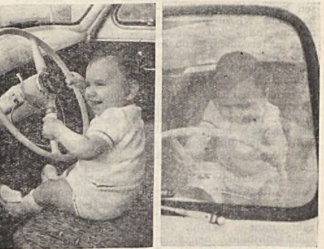
No, lássuk csak!