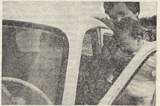
Közel a célhoz